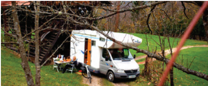
Destinacija Srce Slovenije omogoča avtodomarjem edinstveno izkušnjo doživetja Slovenije