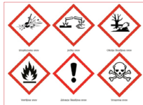
Simboli nevarnih snovi

v večji embalaži, ker lahko med njimi pride do kemične reakcije;