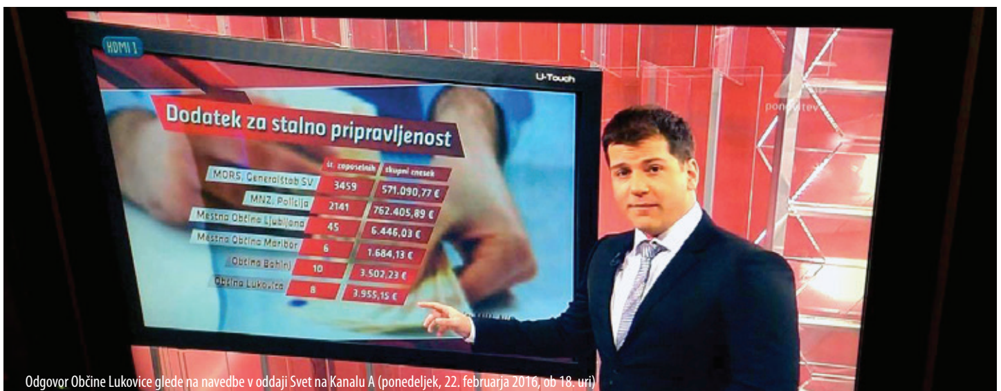
Odgovor Občine Lukovice glede na navedbe v oddaji Svet na Kanalu A (ponedeljek, 22. februarja 2016, ob 18. uri)