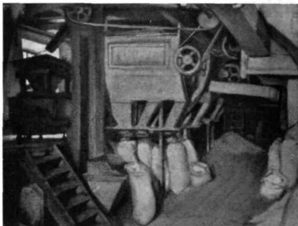
France Košir: V mlinu (olje)

Vpis na zagrebško akademijo mu ni delal težav. Takoj je bil sprejet na to, za slovensko slikarstvo med obema vojnama tako pomembno središče, ki je pod vplivom Pariza posredovalo svojim gojencem slikarsko problematiko. Preko zagrebške šole je slovenska umetnost prvič prišla v stik s Parizom in odslej je vsak