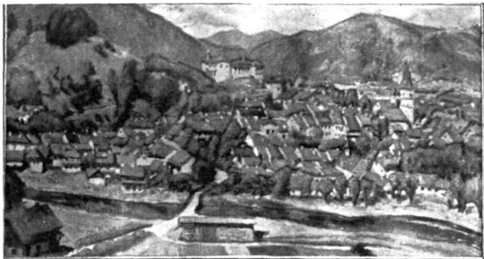
France Košir: Škofja Loka (olje)

skoraj preveč vase pogreznjenega človeka so utesnjevale tudi ozke družbene razmere, kar je skušal preboleti v svojem delu. In ko je še telesno zbolel, se je še strastneje in še siloviteje oklenil dela, se mu docela predal in se ves posvetil samo umetnosti.