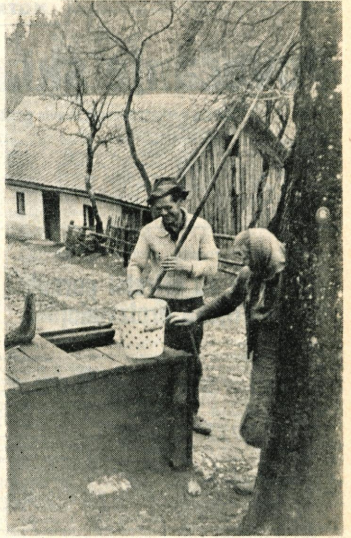
Na Senturški gori nad Cerkljami imajo prebivalci dve želji: zgraditi novo cesto in vodovod. Medtem ko bodo z gradnjo ceste pričeli na pomlad, že dlje razmišljajo, kako se bodo lotili tudi gradnje vodovoda. Z iznajdljivostjo in požrtvovalnostjo, ki so jo pokazali že doslej, bodo prav gotovo uspeli rešiti tudi ta dokaj težaven problem.

3. Stanovalec, ki ni ožji družinski član in ki nima stanovanjske pogodbe ter ne plača stanarine, ali pa jo odsluži z nekim delom, ima pravico do plačila nadomestila v gotovini, ker ni lastnik ali solast-