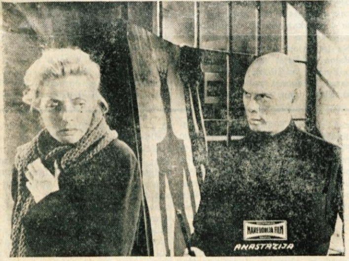
V soboto, 6. februarja ob 22. uri bo v Storžiču v Kranju premiera ameriškega barvnega filma v kinoskopski tehniki ANASTAZIJA. — Proizvodnja: Fox, v glavnih vlogah: Ingrid Bergman, Yul Brynner in Helen Hayes

FILMI, KI JIH GLEDAMO... DIRKA ZA SONCEM Ameriški barvni avanturistični film v kinoskopski tehniki. Produkcija: United Artists, Russ field, 1956. Režija: Roy Boulting.