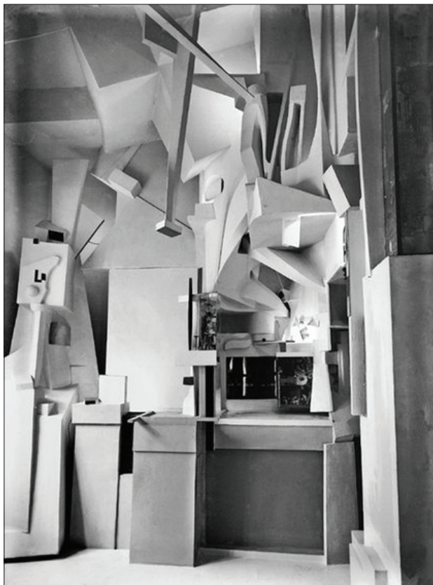
Kurt Schwitters, Merzbau , 1933

iz serije Merzbild 3 (1919–1923) je poudarjal enakovrednost najdenih materialov kot iskanje ravnotežja v dialektiki njihovih lastnosti – uravnovežal je material proti materialu, na primer les proti tkanini, papir proti kovini ipd. V letih 1923–1936 se je obsesivno ukvarjal z gradnjo celostne umetnine ( Gesamtkunstwerk ), ki jo je poimenoval Merzbau . Tako atelje kot bivanjske prostore svoje hiše v Hannoveru je