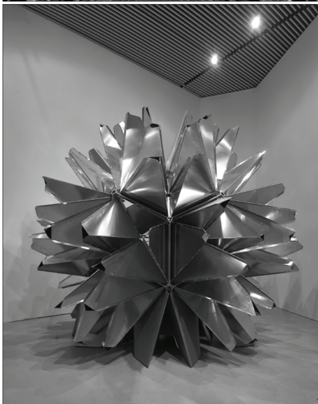
Olafur Eliasson, Multiple grotto , 2004. ARoS Aarhus Kunstmuseum, Danska.

koherentne podobe in samoidentitete lahko sproži občutje posebnega ugodja in sreče v raztopitvi sebe v drugem ali klavstrofobično grozo pred zdrsom v ničnost in praznino.