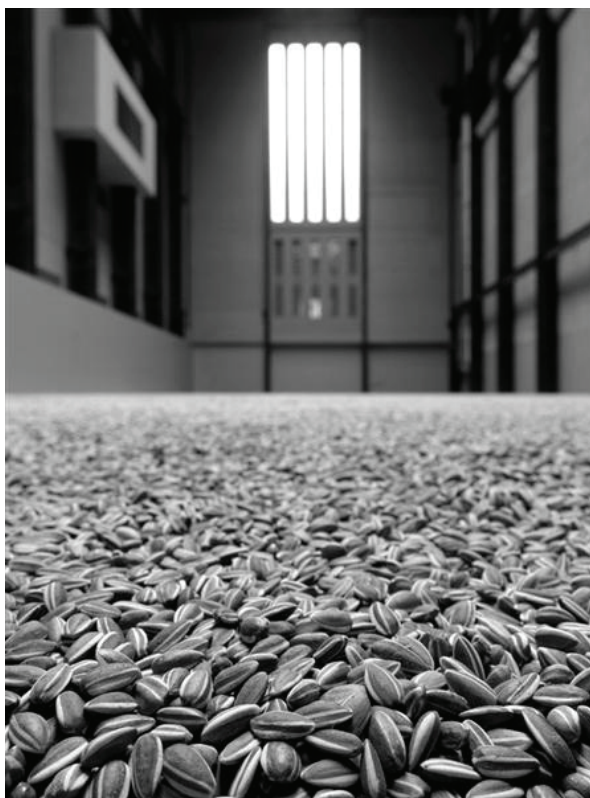
Ai Weiwei, Sunflower seeds , 2010

Instalacija Sunflower Seeds kitajskega umetnika Ai Weiweija (Tate Modern, 2010) ponazarja sodobno prepletenost tehnološkega, simuliranega in realnega. Umetnik je zapolnil velikanski prostor razstavišča z več sto milijoni drobnih porcelanastih sončničnih semen. Čeprav so semena delovala generična, »enaka«, so bila vsa