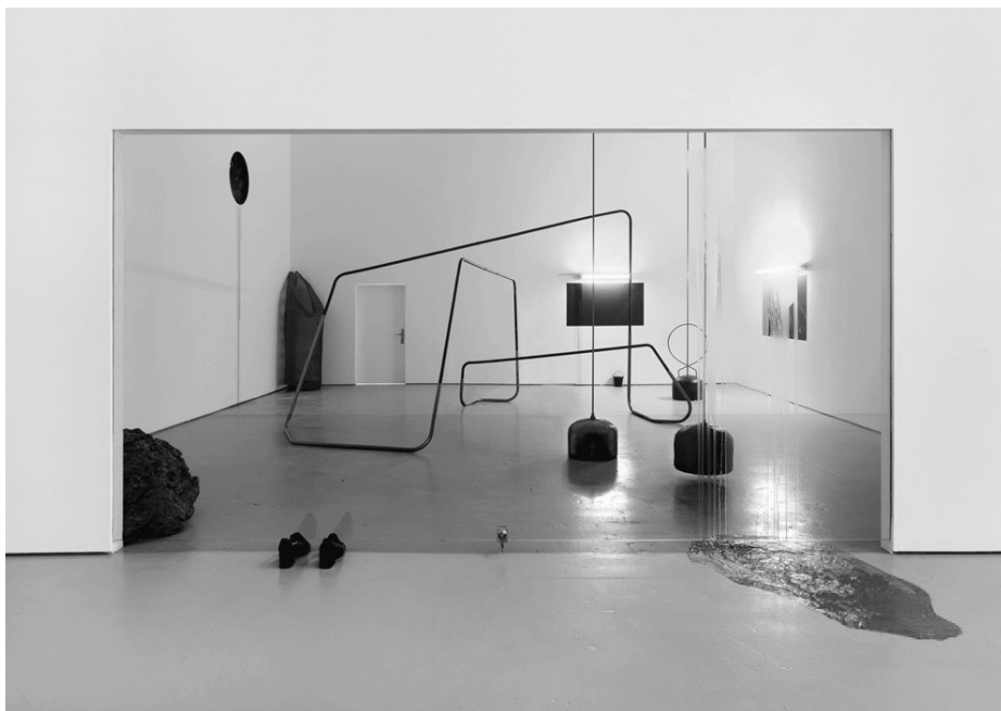
Tatiana Trouvé, The Antechamber , 2009

(Liliana Porter, Edith Dekyndt), razteleženo subjektiviteto in teleprezenco (Mathieu Briand, Roy Ascott), sinestetične in libidinalne nagibe (Christian Jankowski, Tony Oursler). Z osredinjanjem na akustične razsežnosti dela, vzpostavljanjem meditativnih ter spremenjenih čutno-zavestnih stanj in raziskovanjem večdimenzionalne izkušnje hiperprostora (Ryoji Ikeda, Carsten Nicolai, Tatiana Trouvé, Jeremy Shaw) širijo meje zaznavnega in vzpostavljajo nove oblike telesno mentalnega izkustva gledalca.