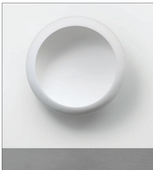
Anish Kapoor, White Dark VIII , 2000

Tudi prostorska, lokacijsko specifična dela Anisha Kapoorja lahko uvrstimo v linijo raziskovanj percepcije skozi tehnologizacijo naravnega. Zaradi formalne izčiščenosti (redukcionizma) in poudarka na »neosebni« estetiki lahko v njegovih