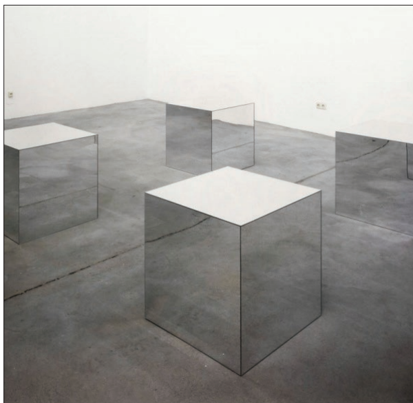
Robert Morris, Brez naslova-Zrcalne kocke/Untitled-Mirrored Cubes , 1965

V tej usmeritvi tudi kiparska dela minimalistov (S. LeWitt, C. Andre, R. Morris, D. Judd in D. Flavin) predstavljajo kiparske konstrukcije, ki niso identificirane s središčem prostora, ampak dobesedno posrkajo in zajamejo obdajajoči prostor. Carl Andre se na primer sklicuje na svoja dela kot »zareze v prostoru«, mase njegovih del valujejo v neločljivi prepletenosti s prostorom. V njegovi instalaciji Eight Cuts (Dwan Gallery, New York, 1967) je razporeditev betonskih elementov zajela celotno galerijsko talno ravnino, razen osmih različno oblikovanih »praznih« enot, ki so razkrile površino spodaj ležečih tal in so utelešale »pozitiv praznine«. Obenem se je okoliška površina zloženih opek obnašala kot diskretno zapolnjena forma, ki je med občinstvom, ki si ni upalo prestopiti praga razstavnega prostora, sprožala vprašanje, »kaj sploh delo je« oziroma »kje se nahaja«.