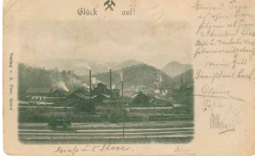
Pogled na železarno konec 19. stoletja, razglednica, hrani Muzej novejšje zgodovine Celje