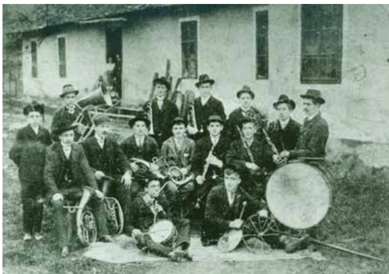
Godbeniki v Štorah pred 1. svetovno vojno (Muzej novejšje zgodovine Celje)

Godba v Štorah je imela svojo tradicijo že pred 1. svetovno vojno. Statut bratovske skladnice Železarne Štore leta 1895 med drugim določa tudi delovanje godbe v Štorah, stroške rudarske godbe in njeno financiranje ob raznih praznikih. Tako je bil vsak član pokopan ob zvokih godbe na pihala.