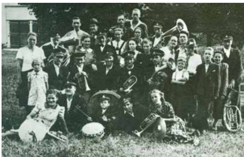
Godba na pihala Štore leta 1940