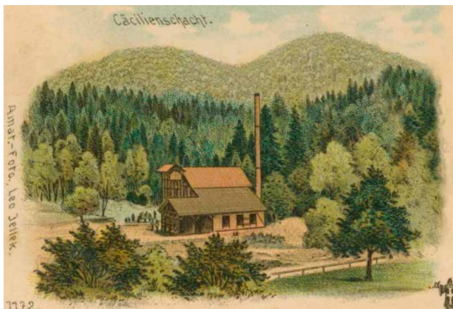
Štore, vhod v rudnik, 19. stoletje, detalj z razglednice, hrani Železarski muzej Štore