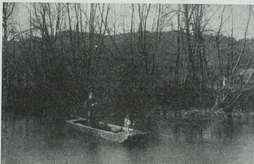
Na Mlinščici — Dolsko