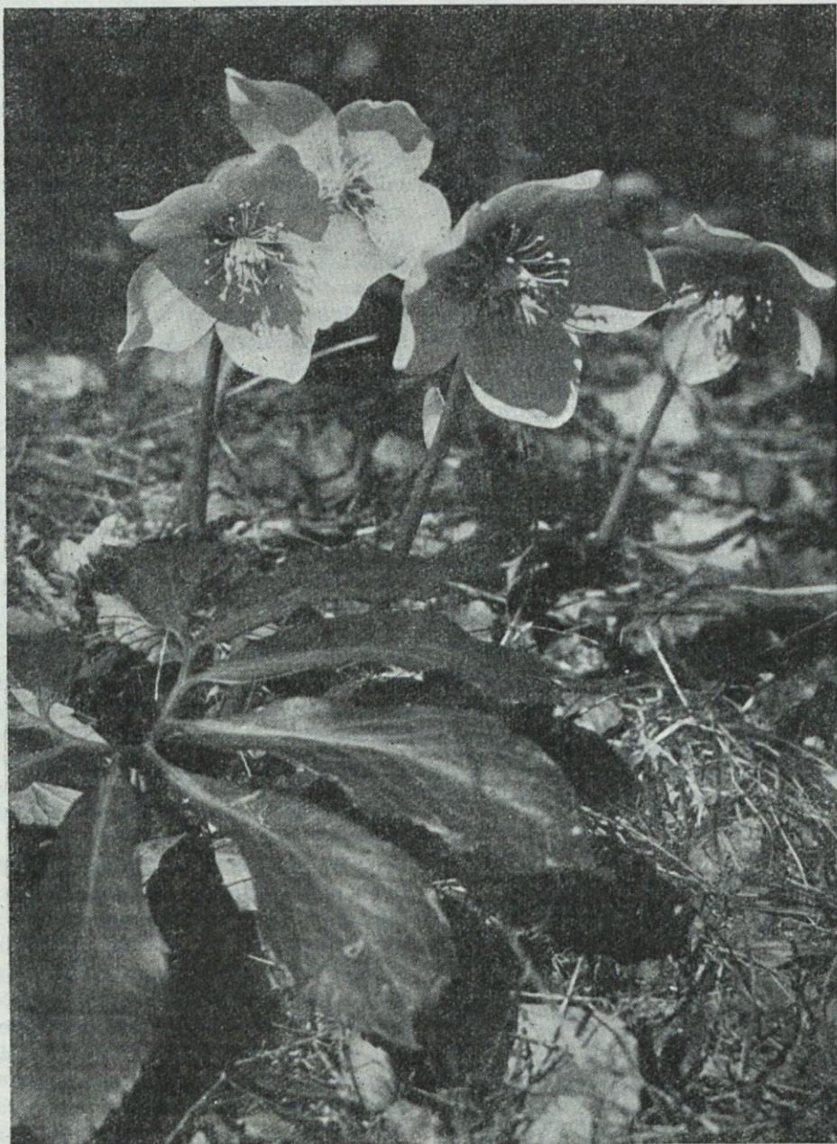
Teloh pozdravlja petelinarje

Vsem lovcem želim v lovskem letu 1961/62 čim več uspehov tako pri gojitvi, kakor tudi pri razvijanju socialističnih načel in miselnosti, predvsem v lovstvu.