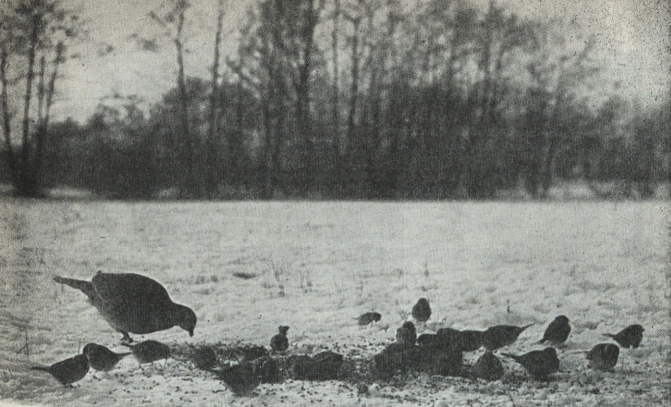
Fazanka in vrabiči