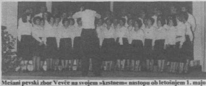
Mešani pevski zbor Vevče na svojem »kristnem« nastopu ob letošnjem 1. maju