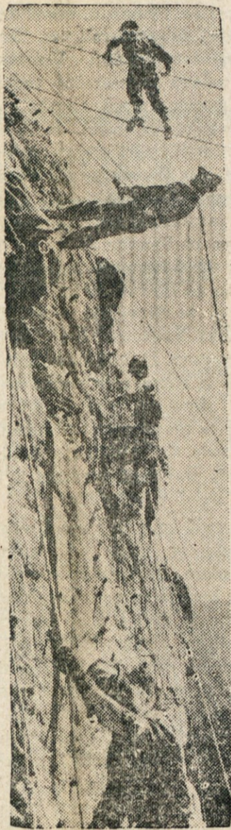
PLANINCI — Kitajski mladinski zbor na Formozu večba svoje člane posebno trdo v vzpenjanju in plezanju v gorah. Slika kaže skupino mladih fantov pri večbanju.

dajati v Cerkvi sami.' — Plula sva nizdol in obstala tikoma nad cerkvijo svetega Petra. Na rdečem prestolu je še vedno sedel sveti oče in obkrožali so ga njegovi rdeči kardinali. Pobožna množica je polnila sveti prostor in sveče so gorele pri oltarjih in svete maše so se opravljale. Pred rimskim papežem pa je klečal mladi duhovnik in prosil, da bi se mu dovolilo vzeti žensko v zakon. In ko je dvignil obraz proti poglavarju svete Cerkve, sem spoznal ta obraz. Ugledal