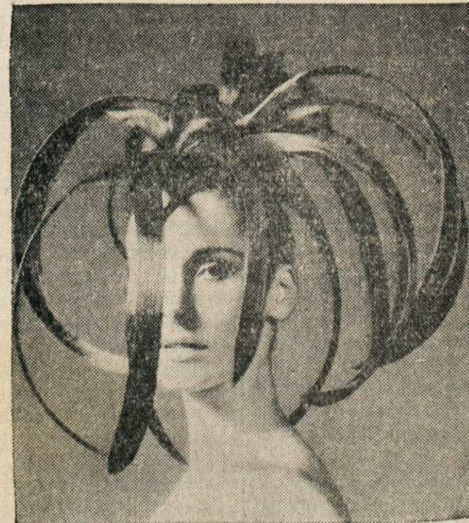
PO VZORU RAJČICE? — Ptica rajčica ima na glavi čop, ki ga lahko vrtil, dviga in spušta. Nečemu takemu je podobna tale frizura, ki jo je pokazal modni salon Filippo v Rimu na Laškem.