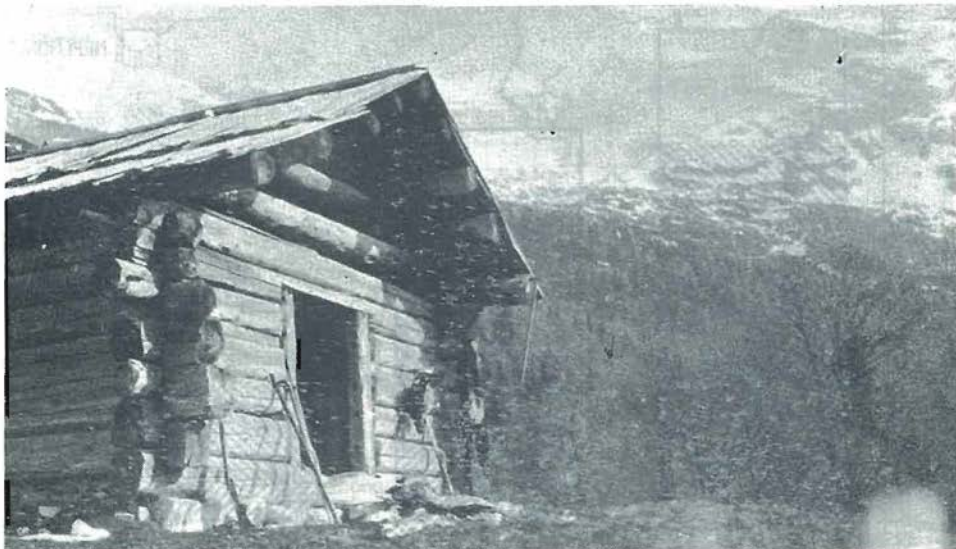
Slika 1: Vhod v stan – planina Trenta (A. B. de Chesne, 1913)

Na planini Prisojnik so pasli vse do leta 1929 Kranjskogorci, dokler niso paše popolnoma prepovedali. Takrat so italijanski gozdarji stan obnovili za svoje potrebe,