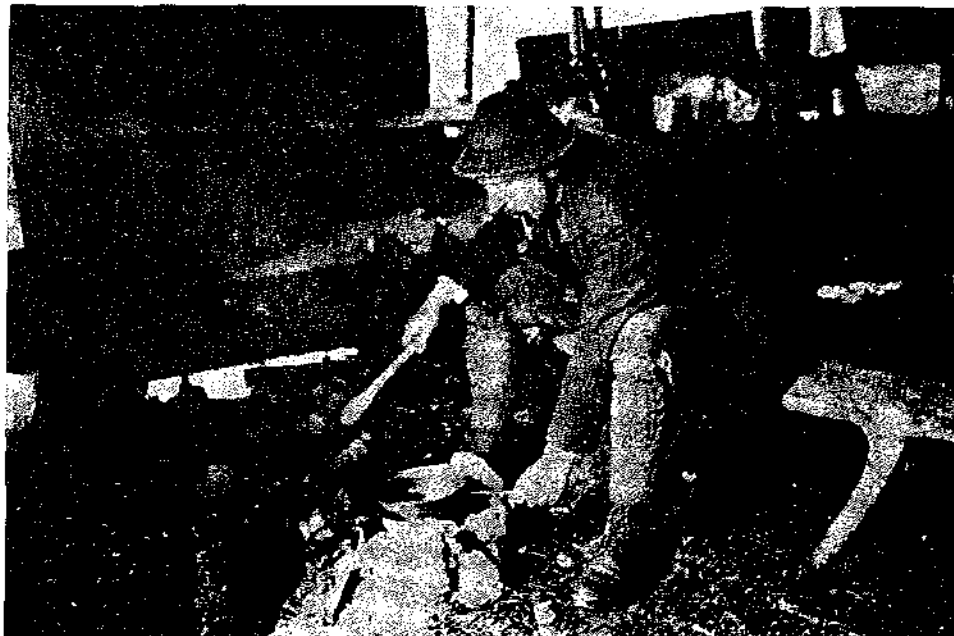
Slika 2: Notranjost stana – planina Prisojnik (A. B. de Chesne, 1912)

Velika planina je zajemala pašne površine v glacialni krnici pod prelazom Vršič, njeni lastniki Podkorenci pa so pasli tudi onstran prelaza. Stan je ležal na levi strani krnice na višini 1495 m. Danes je zelo težko prepoznati mesto, kjer je stal, saj ga je plaz