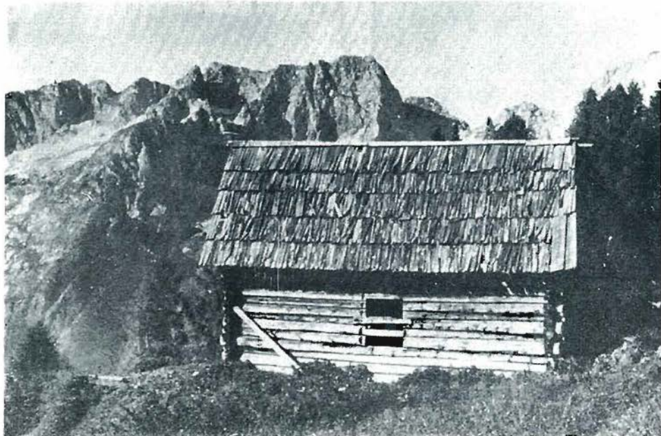
Slika 3: Gozdarska koča na planini Prisojnik (T. Wraber, 1965)

Prispevek ima seveda namen prikazati tudi dediščinsko-varstveno, raziskovalno in turistično vlogo, ki jo ima ta prostor poleg varovalne. Te so v Triglavskem parku še zlasti pomembne. Če naj bi gozdar tukaj sploh kaj počel, potem naj bi krepil te negospodarske funkcije. V prvi fazi so ta dela vezana na ureditev parkovne infrastrukture, kot so ureditev poučnih napisov, pravilno usmerjanje obiskovalcev in celo