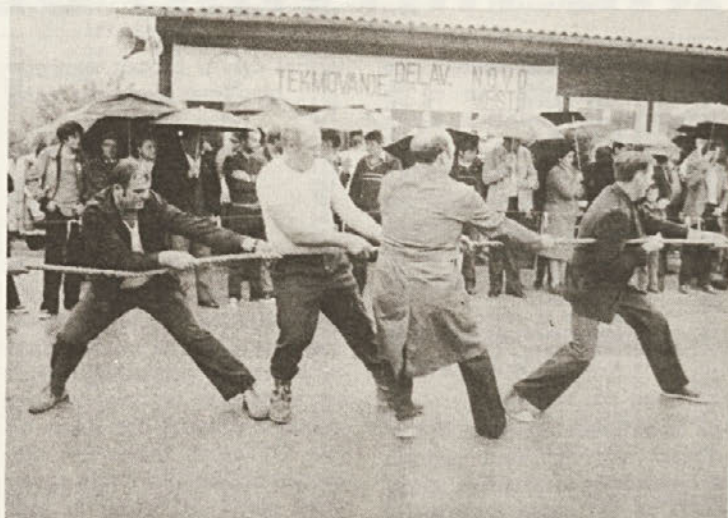
Tudi letos so bili najmočnejši pri vlečenju vrvi Črmošnjičani. Premagali so vse ekipe.