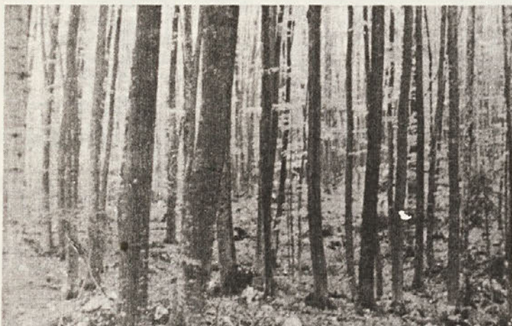
Dvoje pogledov v bukov drogovnjak v oddelku 109 gospodarske enote Drvodelnik. V letih 1928–1934 so bili sestoji v Drvodelniku posekani. Kljub snegolomu (leta 1952, 1957) pa se je ob pomoči gozdarjev po nekaj redčenjih razvil lep bukov drogovnjak. Minulo delo gozdarjev je rodilo lepe sadove.

Tovarišice in tovariši! Nagracjem priskrbo čestitam k priznanjem in jim zaželim pri njihovem nadaljnjem delu še veliko uspehov in osebnih sreč. Skromna priznanja naj vam bodo v spodbudo za čim uspešnejše opravljanje del in nalog na vaših delovnih mestih.