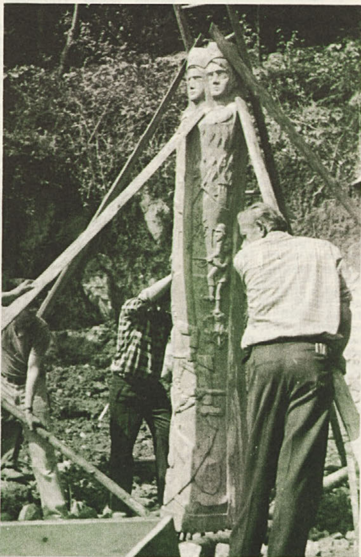
V Podturnu so 23. maja postavili lep spomenik padlim borcem VDV brigade in trem pionirjem iz Topliške doline.