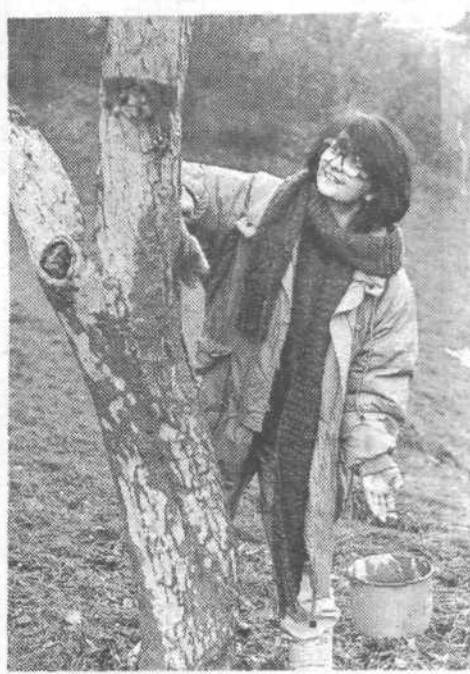
Meta Vrhunc z doma narejenim pre rezom za drevice