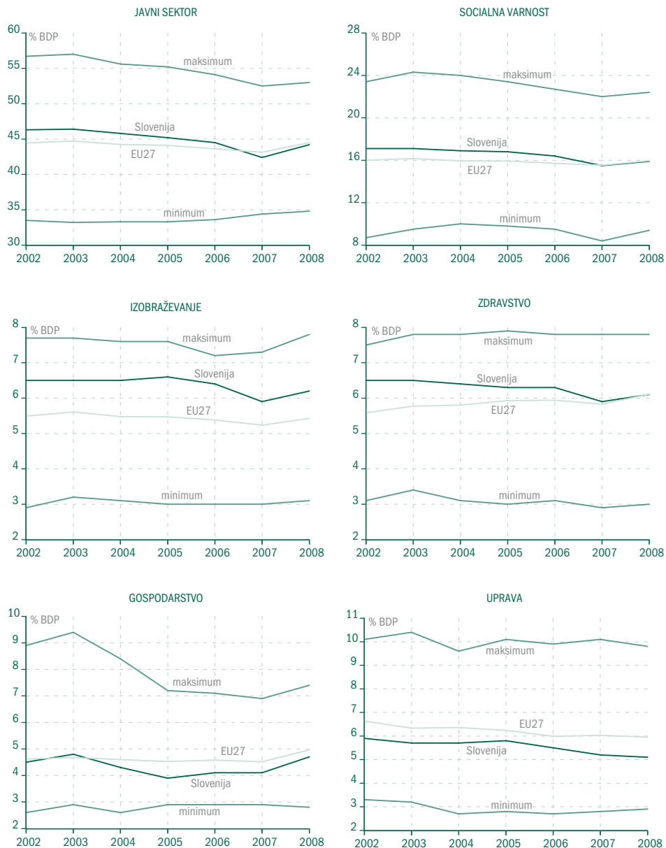
Slika 1 Deleži izdatkov v BDP po funkcionalnih področjih