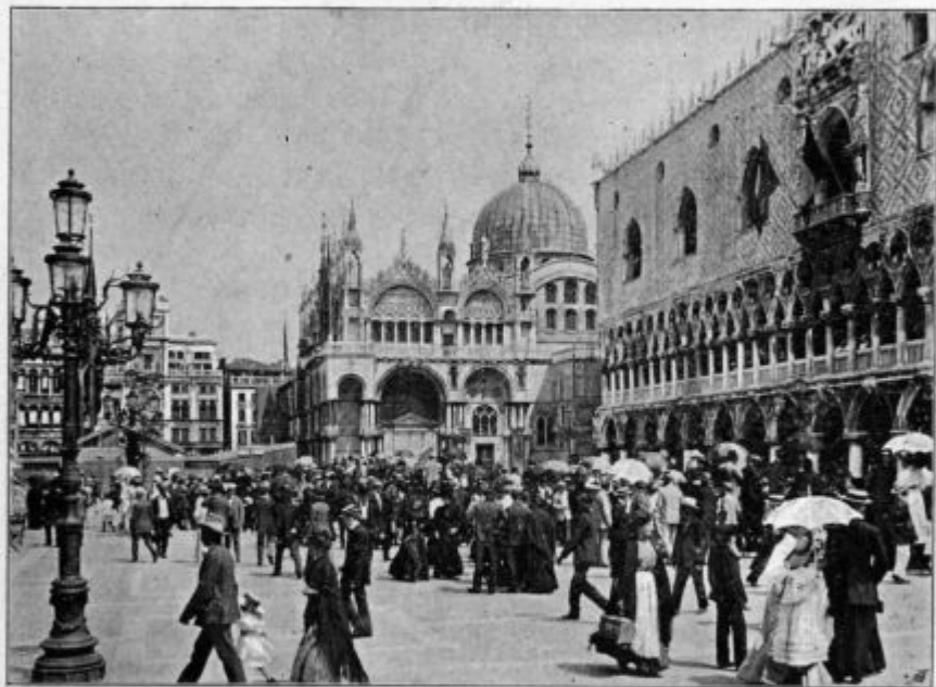
Szv. Marka cerkev v Veneziji.*)

»sze je konec meszeca januárij, to je zacsétek szprotolesnjih dnévov zse priblízsaáo. Ali zaman. Februára 6-ga jo je beteg v posztel szpravo, z stere je vecs ne sztanola. Grozno doszta je trpela vu teli i dusi. Száma je právila ednok »Moje telovne i düsevne bolesine szo prevecs velike; jaz sze ne bi podsztopila vüpati, ka mi G. Bog teliko miloscse dá, ka je tak mirovno lehko prenásam. Molite za mene, naj vu szlüzsbí mojega Bogá do konca sztanovitna osztánem.«