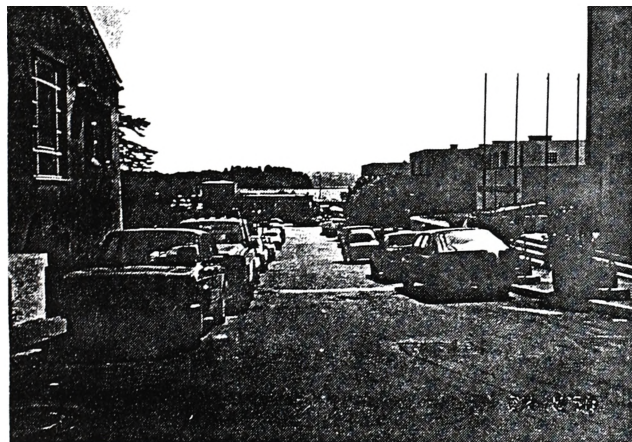
PRED TERMAMI: Ko "pajek" počiva...

Predpis je jasen. Toda kdo je kriv, da v teh in še drugih primerih ostaja kos papirja? Bo morala še kakšna hujša nesreča pokazati s prstom na tiste, ki so dolžni skrbeti za javni red?