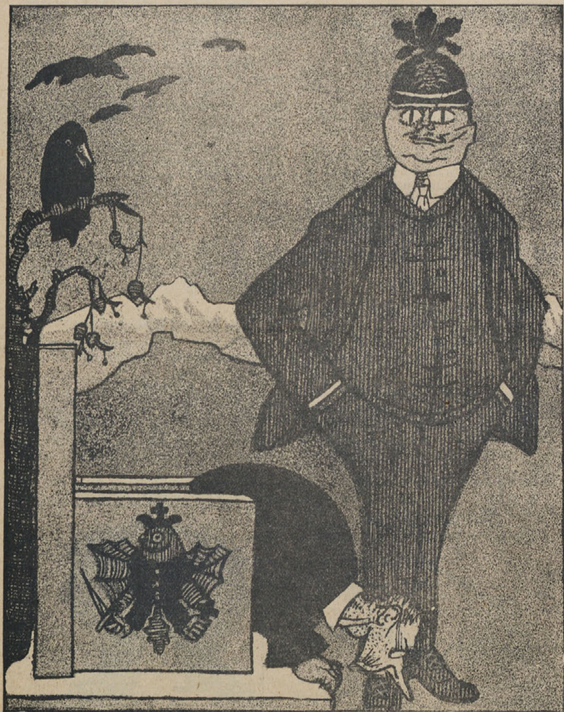
Sedanji slovenski vojvoda . . .