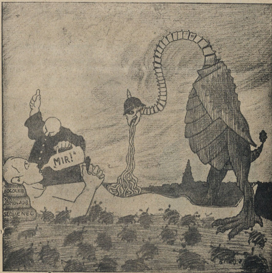
Pesem smrti: „V ‚Miru‘ počivaj . . .“

Zabayno - humoristična nedeljska priloga „Dnevu“.