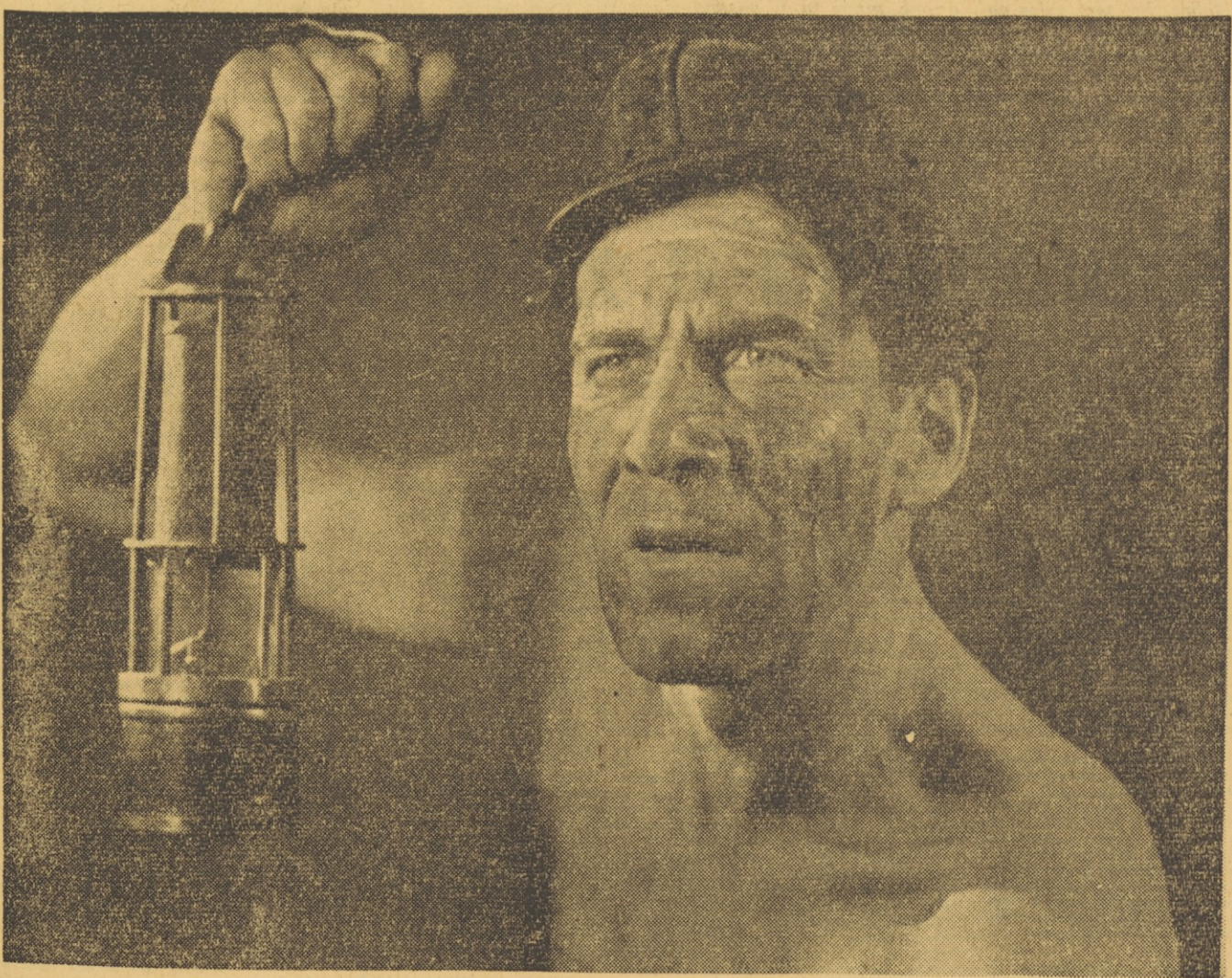
Zdrav delavski duh naj preveva vse naše početje. To misel čutimo na letošnjih zborih sindikatov in tudi na občnem zboru sindikalnega sveta v Trbovljah