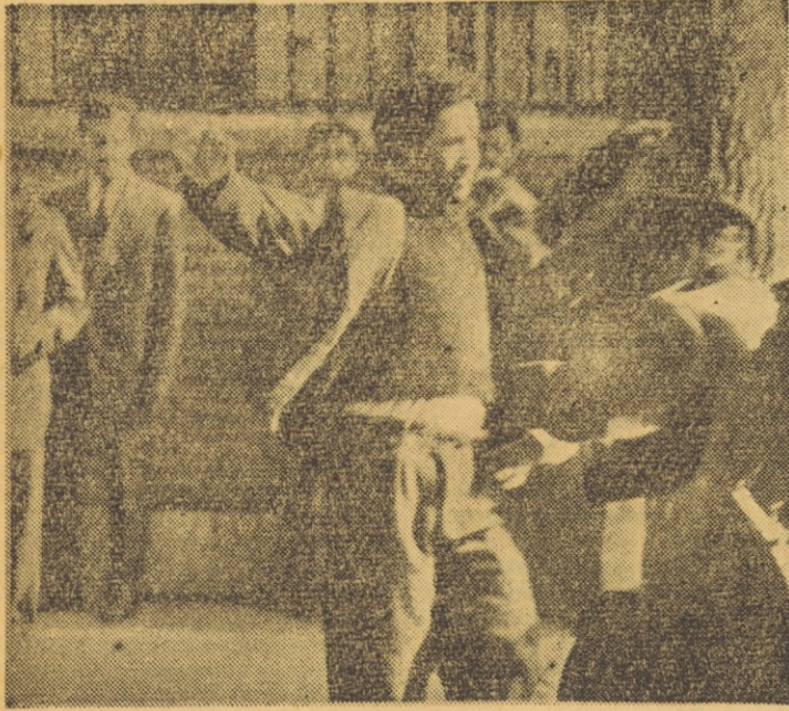
Predvolilni prizor iz Perzije — Sahova policija je aretirala veliko število Mosadikovih pristavev in članov prosovjetske stranke Tudeh ter tako omogočila zmago šahovega režima pri nedavnih parlamentarnih volitvah

Ameriški pristaniški delavci, ki stavkajo že dober mesec, so v minulem tednu pridobili spodbudo na Washington. Okoli tisoč stavkajočih je s tovarnimi avtomobili odpotovalo v ameriško prestolnico in tam demonstriralo pred Belo hišo ter pred poslopijem ministrstva za delo.