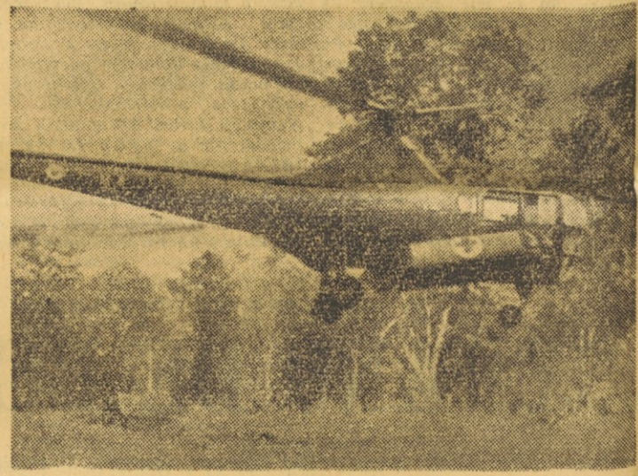
Dien Bien Fu... Borci vietnamske osvobodilne armade so v minulnem tednu vdrli v središče trdnjave — Ranjene vojake francoske in Bao Dajeve vojske prevažajo s helikopterji v zaledje

Na Dunaju je bila zadnje dni marca konferenca predstavnikov mladih socialističnih strank Evrope. Na konferenci so razpravljali o temah: »Evropa danes in jutri«, »Evropa v svetu«, »Mladina in njeni sedanjí socialistični problemi« ter »Mladina in kultura«.