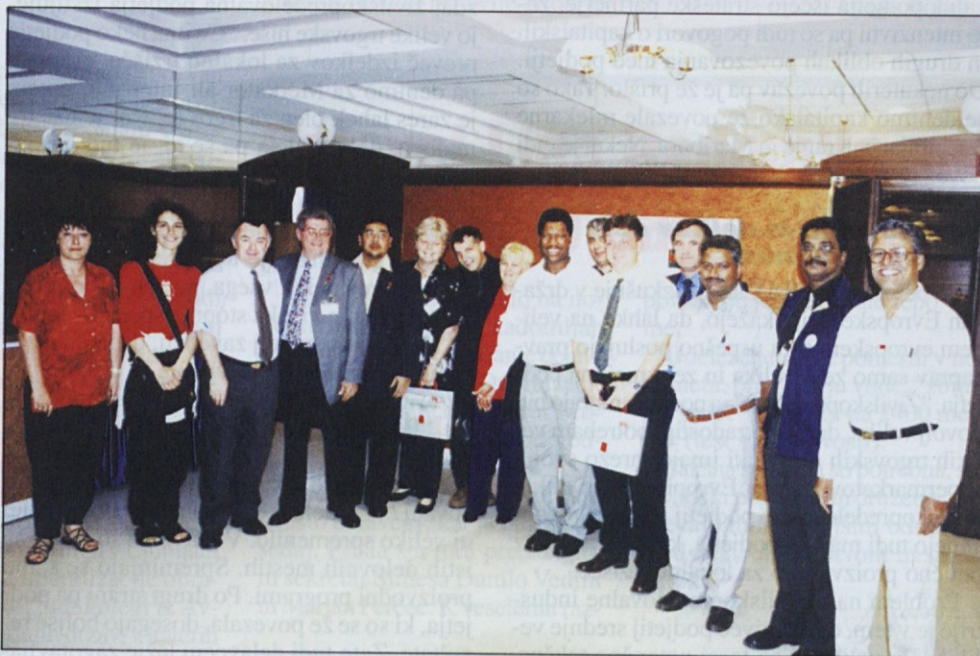
Vodstvo konference in organizatorji so bili po končanem delu zelo zadovoljni.