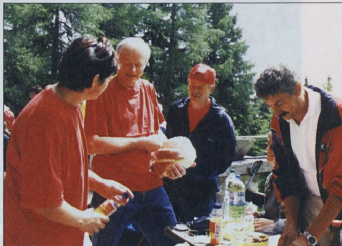
Belokranjci so prvi odprli nahrbtnike.