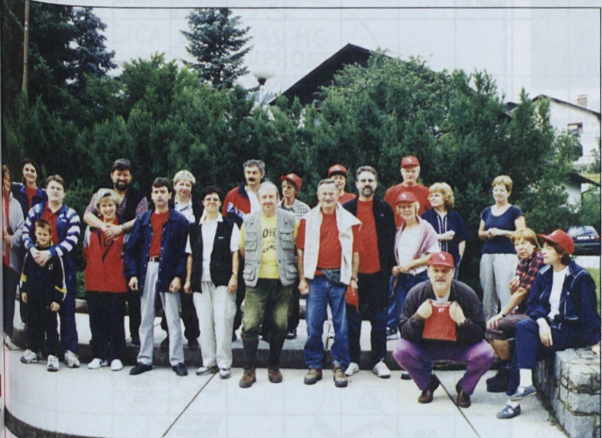
Na zbornem mestu v Mežici nas je organizator opremil tudi z majicami z napisom pohoda in rdečimi kapami ZSSS.