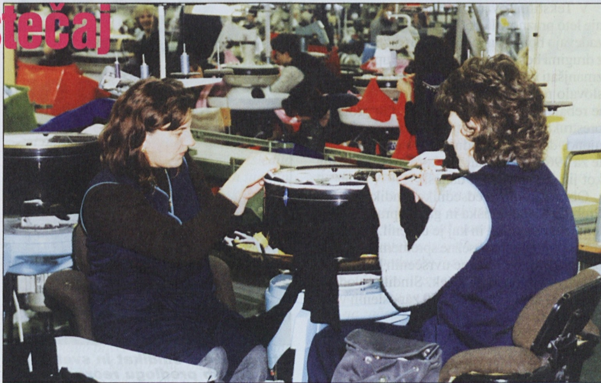
Bodo te delavke še kdaj delale?