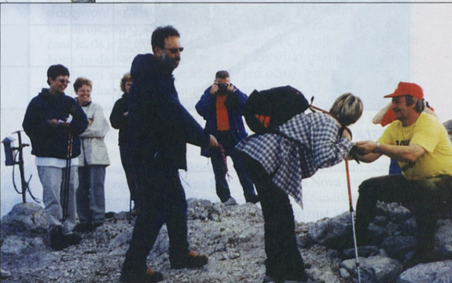
Na vrhu Peci na višini 2126 metrov so udeleženci doživeli tudi planinski krst.