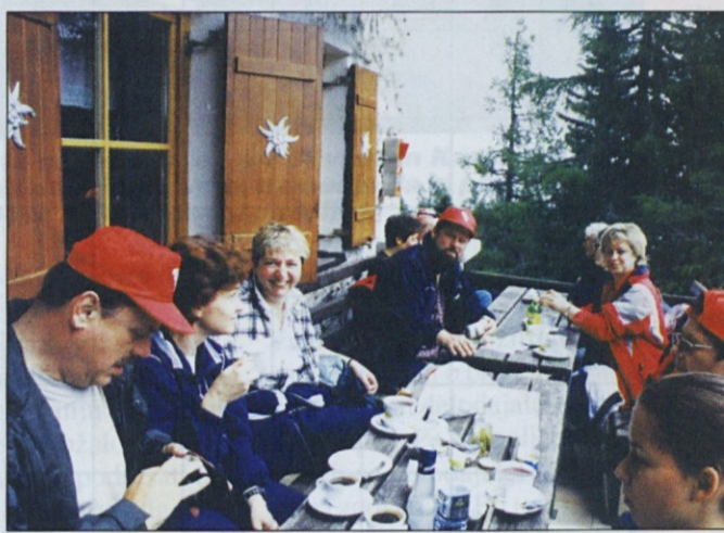
Večina si je pred vzponom privoščila le kaviče in čajčke.