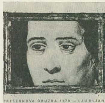
PREŠERNOVA DRUŽBA 1979 - LJUBLJANA

Vicente Blasco Ibanez MRTVI UKAZUJEJO, roman, ki prikazuje doslej literarno malo znana balear-