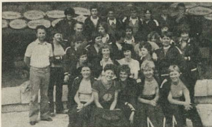
Del udeležencev Lesariade 1979