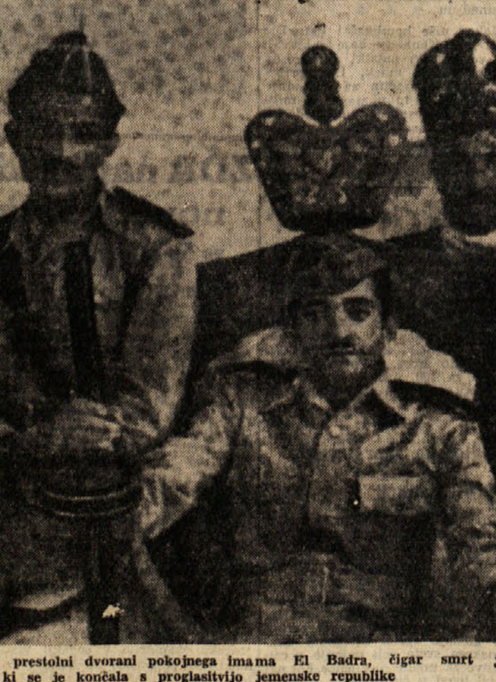
Ta'izz (Jemen): Jemenski vojaki v prestolnici pokojnega imama El Badra, čigar smrti je povzročila krizo, ki se je končala s proglastitvijo jemenske republike