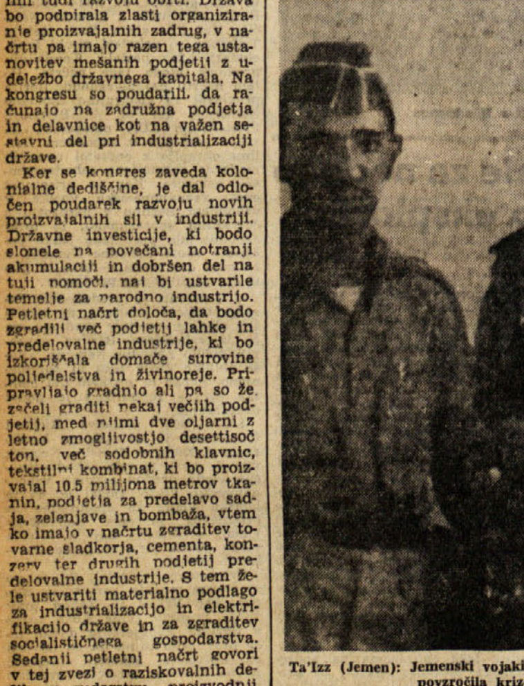
Ta'izz (Jemen): Jemenski vojaki v prestolnici pokojnega imama El Badra, čigar smrti je povzročila krizo, ki se je končala s proglastitvijo jemenske republike

Nesreča se je zgodila, ko je tala, ki vozi na progi Košice-Brno, pristajalo na brnsko letališče, a je iz desle še neznanih vzrokov nenadoma strmoglavilo tla. Pri tem je bilo ubitih 8 potnikov in trije člani posadke, njenci pa so vsi potniki. Na nesrečo se je prišla preiskovati komisija, ki bo skušala ugotoviti, kako je do nesreče prišlo.