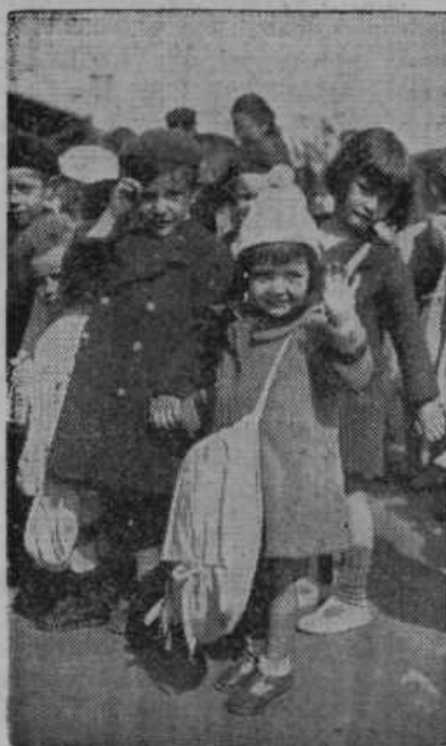
Otroci zapuščajo Pariz, da bi ne oku- sili grozot bombardiranja iz nemških bombnikov

Vse različne tiskovine naročate v Tiskarni sv. Cirila — Maribor