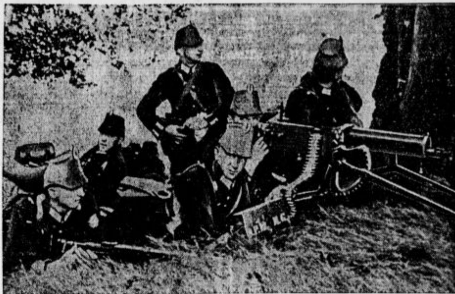
Narodno-socialistična vlada na Meklenburškem je odredila, da se mora tudi deželna policija (Schupo) oborožiti in prirejati prave vojaške vaje. Slika nam kaže policijo v sivi bojni opravi, ko se vadi v streljanju s strojnico. Za Heimwehrom, ki šteje 100.000 mož, Hitlerjevo armado (400.000 mož), se še policija (100.000) mož pripravlja na vojno. Čemu potem Nemčija zahteva še enakopravnost v oboroževanju?

Tribuna F.B.L., tovarna dvokoles in otroških vozil Ljubljana, Karlovska cesta št. 4. 191