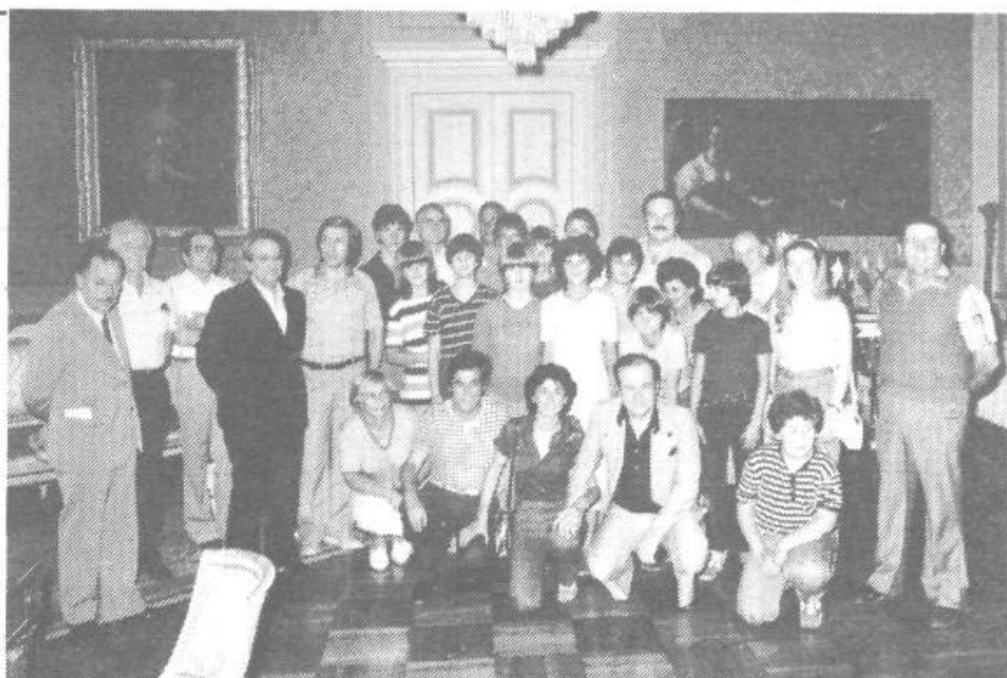
S sprejema pri predstavnikih mesta Parme