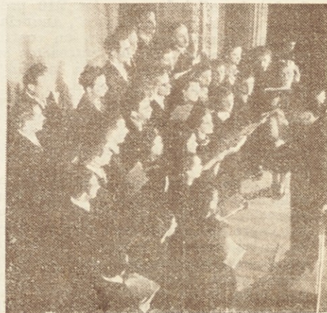
Pevski zbor, ki je nastopil na prireditvi "Duhovnega življenja"

✠ MILENA ZAKRAJŠEK je zapustila starše, stara 4 mesece, in je bila polo-žena k večnemu počitku na pokopališču San Justo. Hčerko edinko obžalujeta oče Alojzij in mati Marija Mišič.