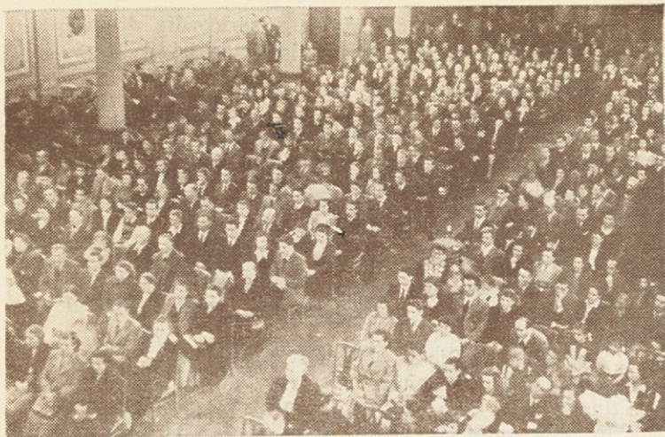
Una vista del público que asistió al Festival de "Vida Espiritual"

bili stari naseljenci prikrajsani. Kakor je bilo napovedano se je spored začel.