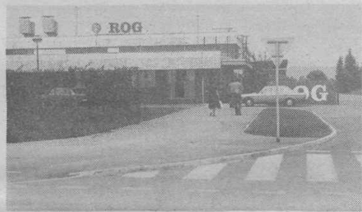
ROG — Taka je zunanost novega Rogovega tozdr Finalizacija

JULON — Čeprav so v novem Julonovem proizvodnem obratu do sedaj že montirali več kot polovico opreme, s poskusno izdelavo sintetičnih vlaken ne bodo pričeli v začetku novembra, kot so sprva načrtovali. Zataknilo se je namreč pri uvozu nekaterih strojev in tako bo prva linija pričela poskusno obratovati predvidoma v prvih mesecih prihodnjega leta. Na sliki: Ekstraktorji, v katerih bodo izpirali granulnat za grobo svilo