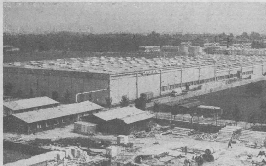
POGLED Z VRHA JULONA — del industrijske cone MP — 3