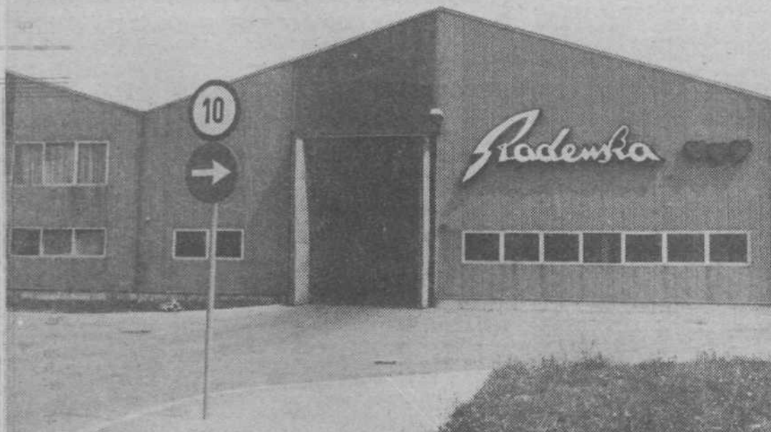
RADENSKA — Tu ima tudi Radenska svoj prodajni center in skladišče za Ljubljano in okolico

Tudi letos so se — že po tradiciji — izmenjali najboljši učenci GIP Gradis in podjetja Bytostav iz Ostrave v ČSSR. V to sodelovanje je letos bilo prvič vključeno enotedensko proizvodno delo. Češki učenci so po opravljenem delu odšli v Gradsov počitniški dom v Ankaran in tam preživeli štirinajstnevnice počitnice. Gradisovi učenci, ki so bili na Češkem, pa so teden dni delali pri adaptaciji počitniškega doma podjetja Bytostav in pri montaži počitniških hišic, štirinast dni pa so preživeli v Malonovicah in od tam obiskovali zgodovinske kraje te prijateljske dežele.