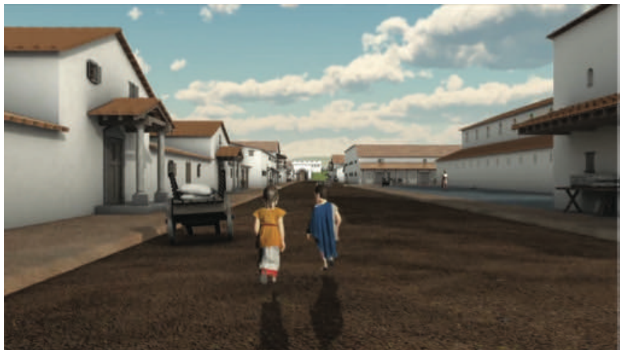
Slika 3: Prizor iz filma »DAN V EMONI«. 17

njenih ulicah. 16 Podobne primere lahko zasledimo tudi na kanalu Narodnega muzeja Slovenije.