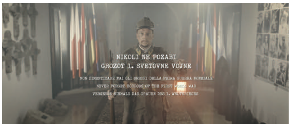
Slika 2: Prizor iz filma »Kobariški muzej – Nikoli ne pozabi grozot 1. svetovne vojne«. 2