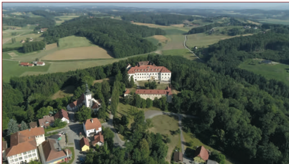
Slika 1: Prizor iz filma Castle Road – promocijski video devetih pomurskih in štajerskih gradov. 1