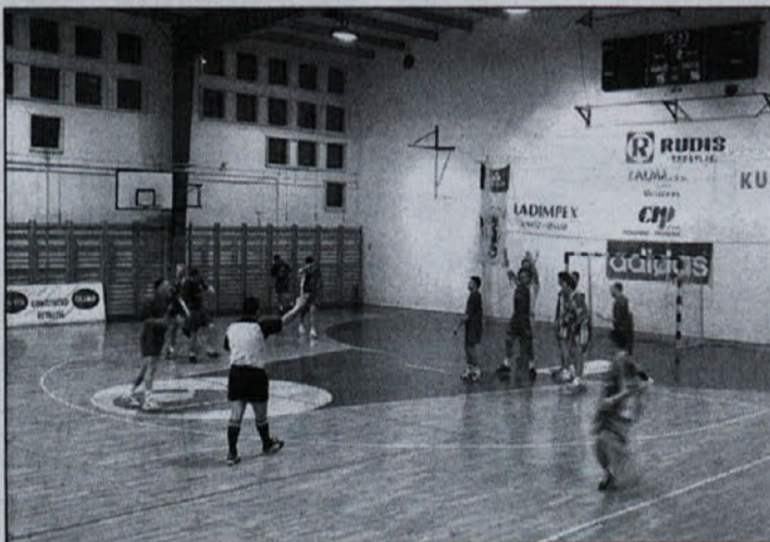
To je le del tistega, kar so gledalci v dvorani videli.

Tekma je imela za obe ekipe velik pomen, za domačo ekipo boj za obstanek, gostje pa so imeli željo preko Dobove priti še bližje zastavljenim ciljem. Prvi polčas so bili gostje dokaj nemočni proti domači ekipi, v tem delu srečanja niso niti za trenutek uspeli povesti, domači pa so po nekaj napakah na koncu prvega dela vodili za gol (14:13). V začetku drugega polčasa so Rudarji zaigrali bolj zbrano in začeli so polniti domačo mrežo, največjo razliko pa so si priigrali do 53. minute (20:26). Domači pa so se vendarle dovolj zbrali, da so gledalce navdušili in da se ni zgodil poraz, tako kot so mnogi že pričakovali, zadnje sekunde srečanja so zadali udarec Rudarju, ki se je moral zadovoljiti z neodločenim izidom (29:29), čeprav so bili prepričani, da imajo zmago že v žepu.