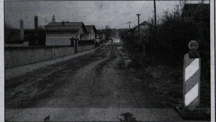
Regionalna je bolj podobna poljski poti, cesta je zaprta, obvoz je označen in urenjen.

Investicijska vrednost del je 190 milijonov SIT, od tega bo Direkcija Republike Slovenije za ceste prispevala 124 milijonov SIT, sofinancerski delež občine Brežice pa znaša 66 milijonov SIT. Suzana Vahtarič