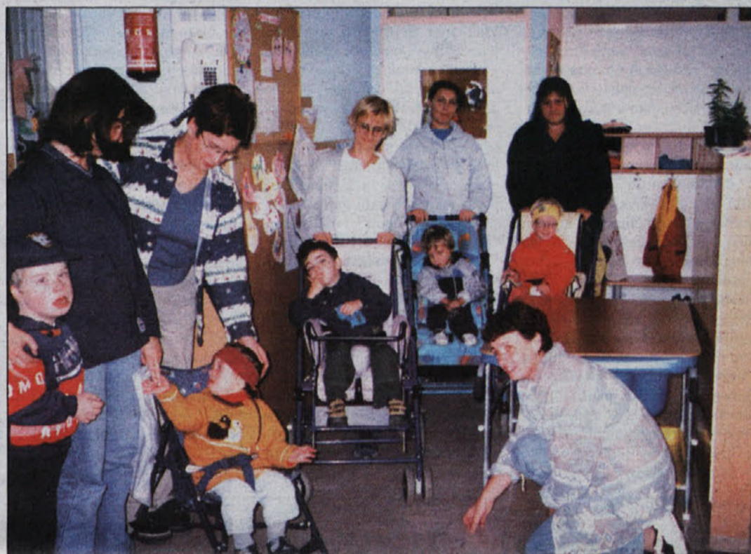
Varovanci Razvojnega oddelka Vrta Mavrica z vzgojiteljico in pomočnicami