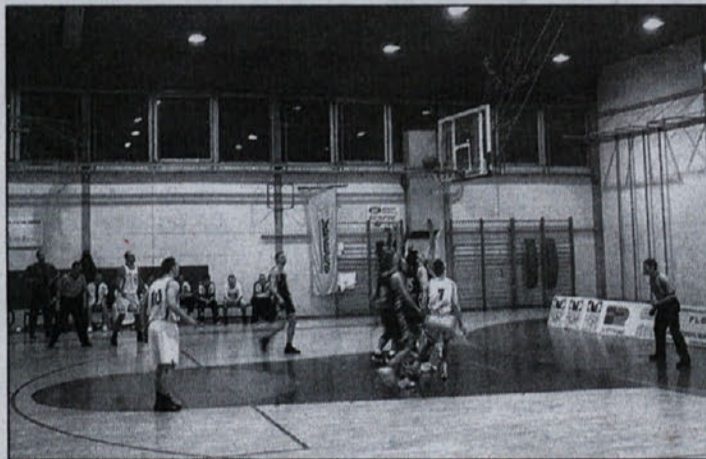
Zadnja četrtina bi lahko bila pogubna, a domači so se vendarle dovolj zbrali in goste pošteno "naprli".

Krško – Košarkarjem KK Krško je v zadnjem, šestem krogu kvalifikacij za vstop v 1.B SKL v domači dvorani uspelo s potrebno razliko z 71 kosev premagati gostujočo ekipo KK Postojna z rezultatom 94:73. Tako se Krško vrača med prvoligaše. K.M.