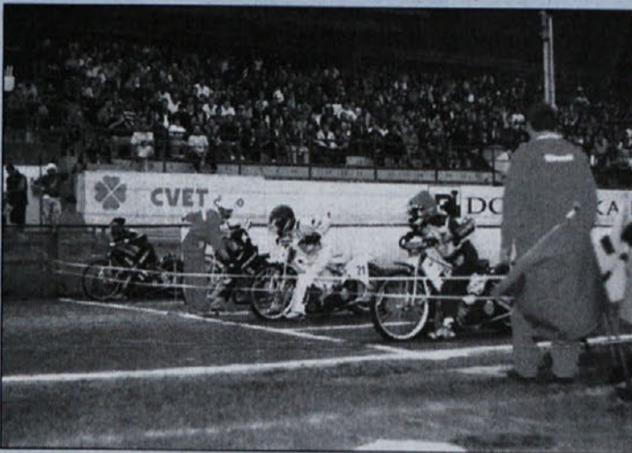
Tako je bilo lani na Zlatem znaku v Krškem.

Stadion Matije Gubca bo letos organizator sedmih dirk, prav gotovo pa bo smetana vseh Grand prix challenge 18. oktobra. Čeprav je res, da je vsaka dirka na Matiji Gubca pravi spektakel, tako po zaslugi organizatorjev, kot tudi po zaslugi najzvestejših navijačev, ki so znani po vseh domačih in na mnogih tujih dirkališčih. Letošnja sezona bo dolga in pestra – naj se končno začne!