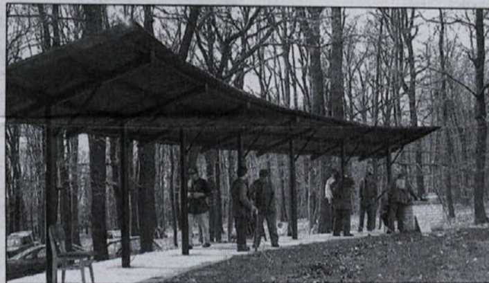
Letos so se v Globokem zbrali tekmovalci že tretjič.