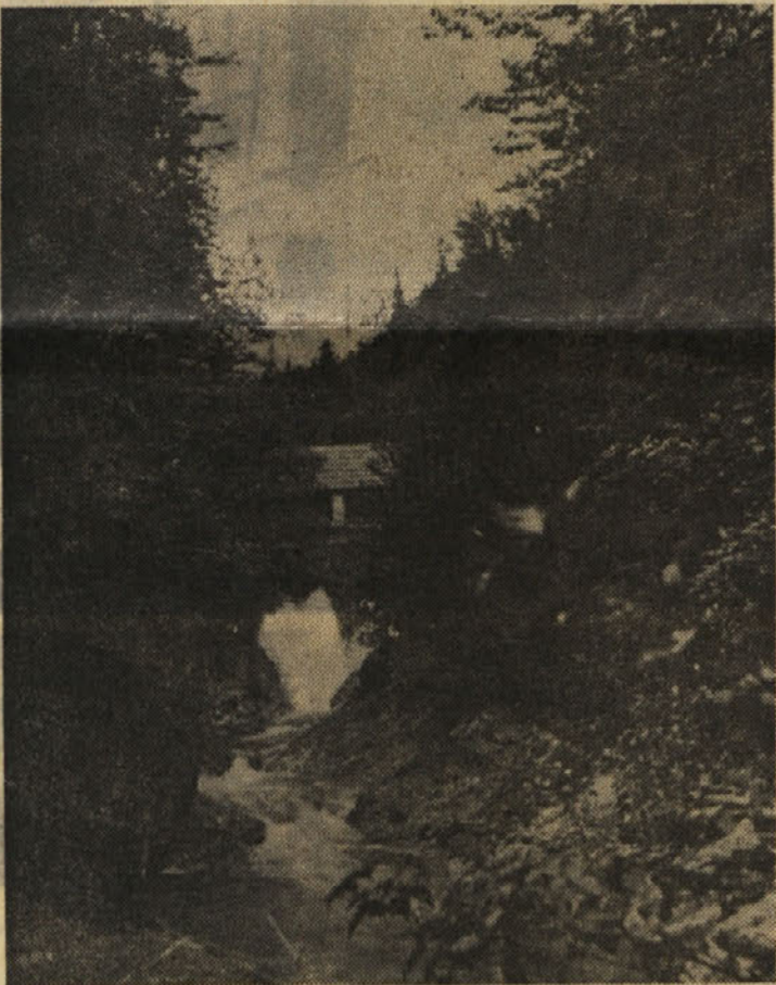
Klavže na Belci so najmanjše, vendar so dalj časa ohranile kožo nad zidovjem, kjer so gozdarji imeli toplo zavetišče in ognjišče.

Nekoč so živorebrno rudo žgali z drvmi, zato so potrebovali veliko lesa - Ker je bil dovoz težaven in drag, so si pomagali z vodnimi tokovi - Odtod jezovi in zapornice - klavže