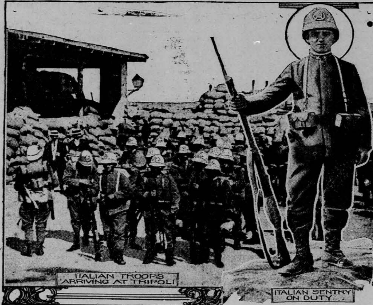
ITALIAN TROOPS ARRIVING AT TRIPOLI. ITALIAN SENTRY ON DUTY.