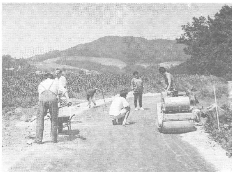
Krajani so aktivno sodelovali pri urejanju svoje ceste