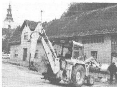
Nadaljevanje gradnje kanalizacije