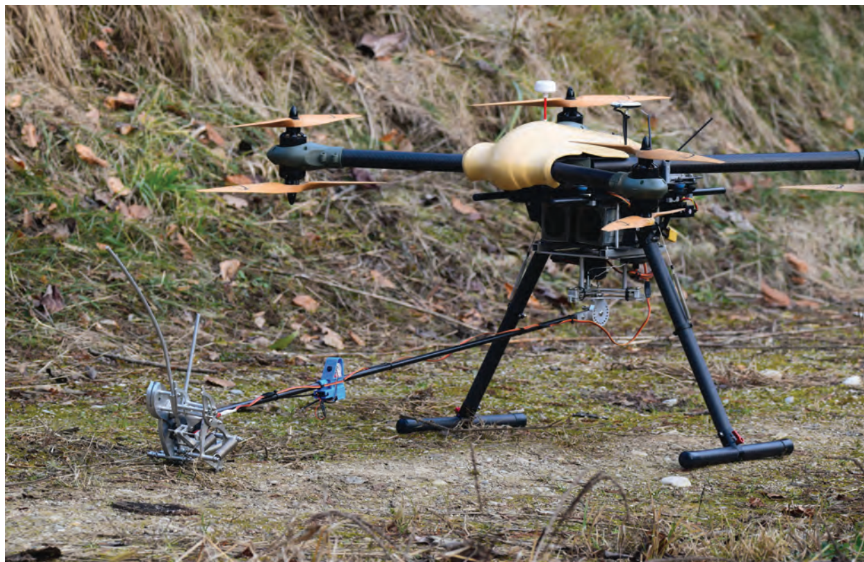
Slika 1: Prvi prototip sistema Lucanus nameščen na brezpilotnem letalniku Sky Hero Spyder X8. Figure 1: First Lucanus system prototype mounted on a Sky Hero Spyder X8 drone.

Z namenom odprave naštetih pomanjkljivosti in implementacije lastnih idej je Oddelk za gozdno fiziologijo in genetiko na GIS v sodelovanju z mladinskim tehnološko-razvojnim centrom Zavod 404 v okviru projekta EUFORINNO pripravil načrte za napravo vzorčenja drevesnih krošenj z brezpilotnim letalnikom z imenom Lucanus (GIS & ZAVOD 404, 2016; Slika 1; Slika 2).