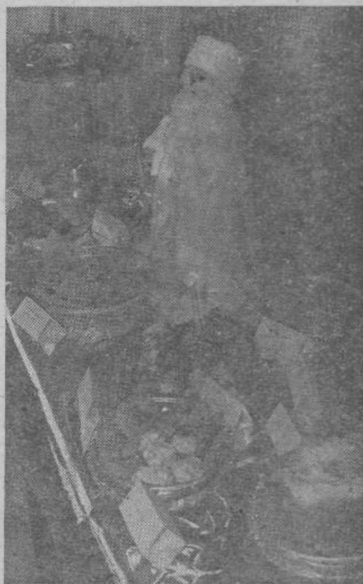
Dedek Mraz je na mizo znosil dišeče dobrote, pravcate kulinarčne podvige. Nekateri bodo ob tej sliki seveda zlobno pripomnili, da bodo dobrote kmalu nasploh povezane kvečjemu še z dedkom Mrzom in drugimi mitološkimi bitji...