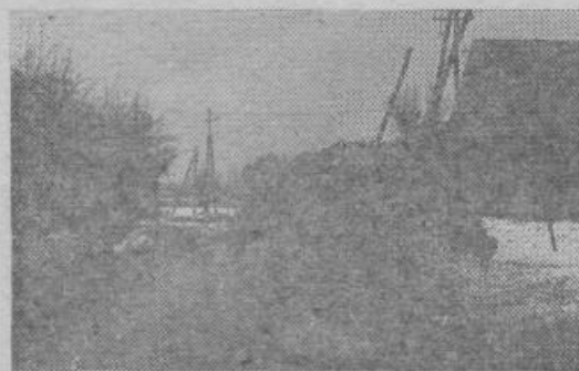
Pridni kmetje tudi pozimi ne počivajo, nekateri tudi zdaj gnojijo travnike. Pritožujejo pa se, da gnoja primanjkuje — menda se ga preveč porabi v kulturniških polemikah...