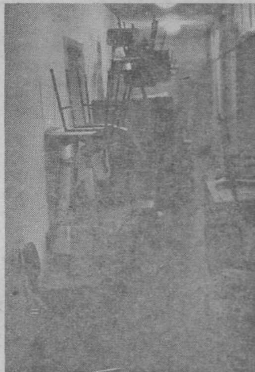
Da ne bi morda kdo pomotoma pomislil, da so se v kateri izmed delovnih organizacij odločili zmanjšati družbeno režijo ter so nekoliko izpraznili pisarne. Nak — samo prostore so belili. Menda so režijci celo med beljenjem stražili svoje stolčke. — Saj razumete, nikoli se ne ve...