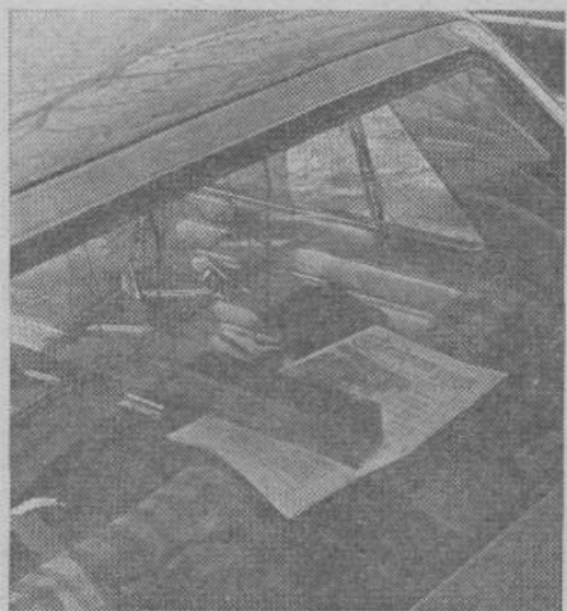
Ste že kdaj vozili železno traverzo v avtomobilu, pa niste vedeli, kaj bi položili pod njo? Nič lažjega: vzemite Javno tribuno in ne bo vam žal. Dobra reklama, kaj?