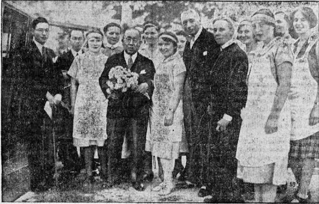
Japonski obisk v Berlinu.

»Kaj pa izvaja sedaj?« »Deveto simfonijo.« »Moj Bog, kaj smo prvih osem že zamudili?«