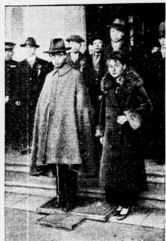
Henry Pu Yi,

bivši kitajski cesar in sedanjí predsednik nove mandžurske republike, s svojo ženo ob prihodu v Čangčung, novo prestolnico 28milijonske države