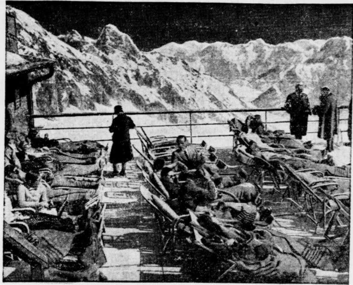
Velikonočni gostje na terasi hotela na Zugspitze