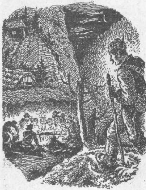
Gasparljeva ilustracija rokovnjaškega tabora

Rokovnjači z vodiškega in smledniškega konca so obvladovali tudi druge kraje naše občine. Posebno veselje so imeli nad tremi romarskimi točkami — Skaručno, Šmarno goro in Dravljami. Ob raznih verskih slavnostih so imeli spricho velikega števila ro-