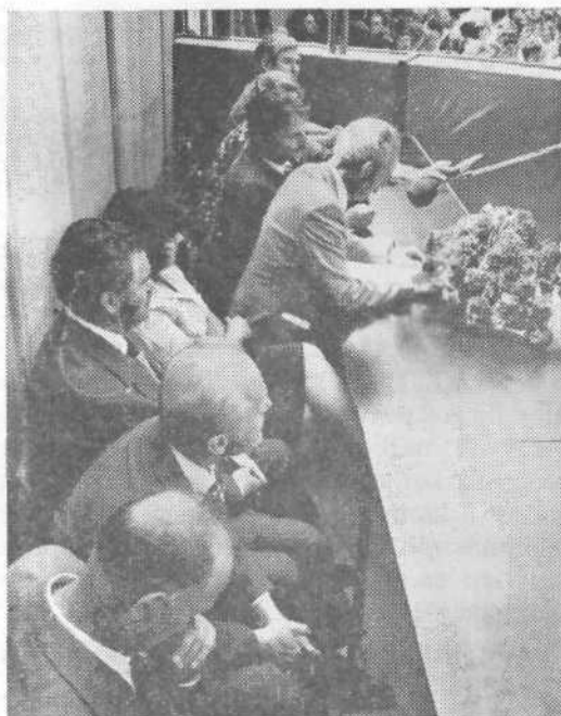
Delovno predsedstvo svečane seje

Čudovito junijsko sobotno dopoldne, v prvi požgani slovenski vasi Rašici, Slavnostno urejena tribuna sredi jase ob poti na razgledni stolp je dajala že pred pričetkom proslave impozantno sliko, ki je bila pozneje, ko so jaso napolnili obiskovalci, odeti v žive barve še mnogo svečanejša.