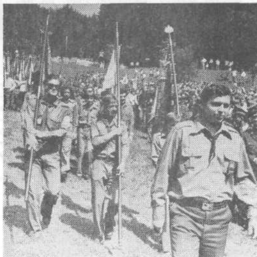
Udeleženci občinske proslave

Najprej je orisal zgodovinske dogodke iz časa NOB in povelje naše domovine, nato pa je poudaril, da moramo tudi danes prijeti za delo in tako še hitreje in še bolj premočrtno oblikovati našo družbo ter bogatiti materialno in duhovno osnovo delovnih ljudi Slovenije in vsega slovenskega naroda v trdni povezanosti z drugimi narodi in narodnostmi Jugoslavije. Hkrati je opozoril, da je v svetu še vedno mnogo takšnih sil, ki so sicer doživele svoj vojaški poraz leta 1945 vendar zdaj recimo prav na Koroškem spet dvigajo glavo. To je resen opomin vsem demokratičnim in naprednim silam v svetu.