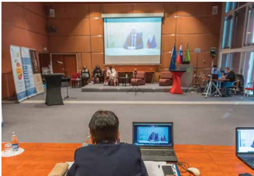
8.e-konferenca MSP - deloma v živo, deloma preko spleta

Po projekcijah Predstavništva Evropske komisije v Sloveniji bi lahko učinkovito izvajanje NextGenerationEU že do leta 2024 zagotovilo 2% dodatnega BDP in ustvarilo 2 milijona delovnih mest. Po oceni namestnice vodje Predstavništva Evropske komisije v Sloveniji mag. Ulla Hudina Kmetič je kriza ponovno pokazala pomen enotnega trga in potrdila ugotovitev, da vsi plačamo ceno, ko enotni trg ne deluje nemoteno.