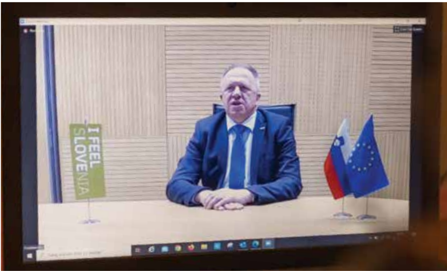
Zdravko Počivalšek, minister za gospodarski razvoj in tehnologijo