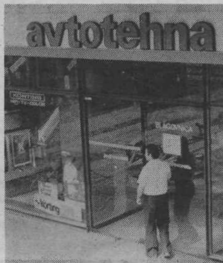
V Avtotehni so se resno zavzeli, da bodo uredili razmere in se prilagodili novim pogojem najkasneje do konca leta