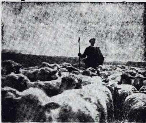
Naš pastir pase 2500 ovc v Franciji.

zaistino orli, ki so v Sunce — Boga gledali i strmeli po visini, po jakosti. Določo se vam je namen: nikdar ne igrati v krčmi pri plesnoj veselici, nego izključno pri verskih i narodnih prireditivah brez plesa. Dovolilo se vam je igrati po gostivanjaj i pozdrave za god. Držali smo vas i ste bili zaistino kršćanska godba. — Par let pa že vмира stari duh pri vas. Sunce vas ne vleče, nego zaslužek. Razložka med vašov i drugimi bandami več nega, pa če je, je te, da igrate tam, kde niti one ne igravo. Tak iti to ne sme naprej. Zavolo odgovornosti pred Bogom, določite si pravila, dajte je od višje cerkvene oblasti potrditi i bodite zaistino edna cerkvena godba, ki Božoj časti ne bo škodila, nego