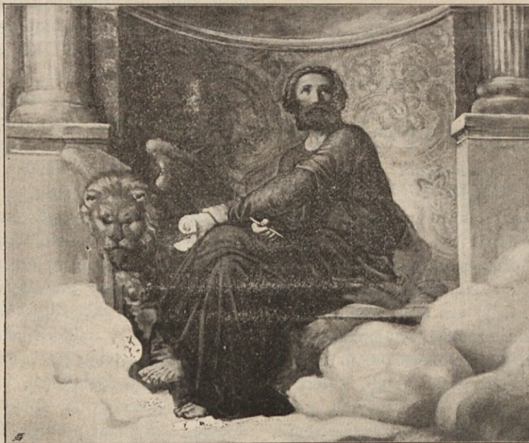
Sveti evangelist Marko.

Moč in jakost človeka je v njegovi krvi in žilah, vrednost naroda v njem samem. Kdor noče sam sebi dobro, temu ne pomaga nihče: ne vlada, ne zbor, ne poslanec, ne občina. Ne zanašajmo se na druge. Čelajmo sami napredno, vedno bolje, varčujmo pametno ter redno živimo in lahko bomo zapeli: Še slovenska ni propadla, dokler — živimo: še visoko bode stala — ko jo zbudimo!