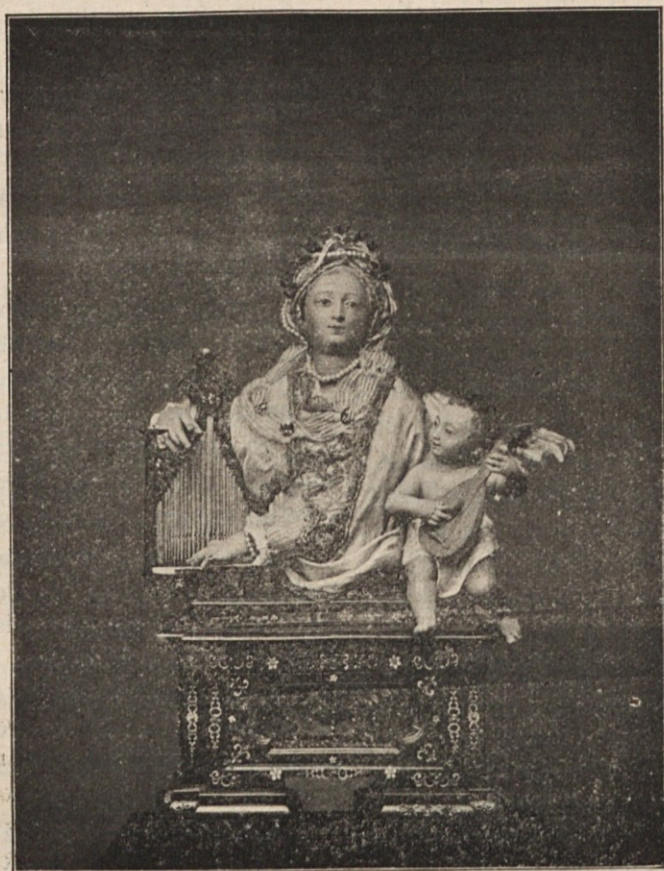
G l a s b a.