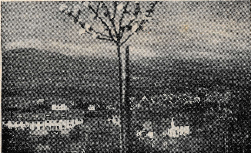
Rakovnik: Pogled na bližnjo rakovniško okolico z Galjevico, kjer se je že precej družin posvetilo presvetemu Srcu Jezusovemu.

Salezijanski sodružniki, ki se štejejo med najboljše sinove nebeškega Očeta in našega malega naroda, morajo potrebne brate sprejemati v tem duhu in prepričanju. Samo tedaj bomo izpolnili željo in zahtevo našega