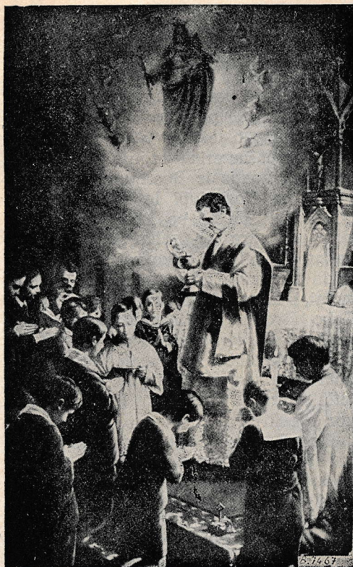
Sveti Janez Bosko, apostol pogostnega svetega obhajila med mladino.

bližnjega škodo: da bi pretirano stregel svojemu telesu, zapravljal, pijančeval, stiskal uboge in si s tem zaslužil pekel in izgubil nebesa.