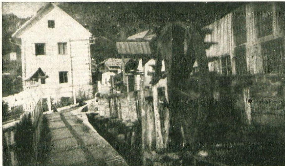
Vodno kolo Globočnikove fužine, demon- tirano leta 1947

Na pustni ponedeljek so se v šestem razredu osemletke pri zemljepisni pogovarjali o Veliki Britaniji. Ta otok ima na jugozahodu Cornwallski polotok. Ko je profesorica enega izmed dijakov vprašala, kako se ta del Velike Britanije imenuje, je namesto Cornwall gladko odgovoril: karneval.