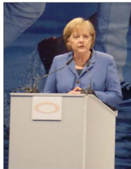
Zvezna kanclerka Angela Merkel na 2. ekumenskem zboru v Münchnu

so resnicoljubnosti in potrebni reformi v Cerkvi. Papež Benedikt XVI. je v pozdravnem pismu, ki ga je ob odprtju shoda prebral münchenski nadškof Reinhard Marx, omenil te črne oblake, ki so zatemnili nebo nad Cerkvijo in načeli zaupanje pri številnih kristjanih. Obenem pa je vse navzoče povabil k obnovljeni ljubezni do Cerkev in k še večjemu soodgovornemu deležu pri oblikovanju verskega življenja v skupnostih in v celotni družbi. Prav tako je nemški zvezni predsednik, evangeličan Horst Köhler, zbrane nagovoril, naj ne izgubljajo zaupanja in potrpljenja. V Cerkvi naj vidijo tudi vse tisto, kar se dobrega naredi, predvsem za mlade. Omenil je karitativno razsežnost nemške cerkve, ki s številnimi dobroteljnimi organizacijami (Missio, Misereor, Adveniat idr.) lajša revščino po celem svetu, skrbi za šolanje in izobraževanje v revnih predelih sveta, vodi in še na novo odpira številne zdravstvene projekte.