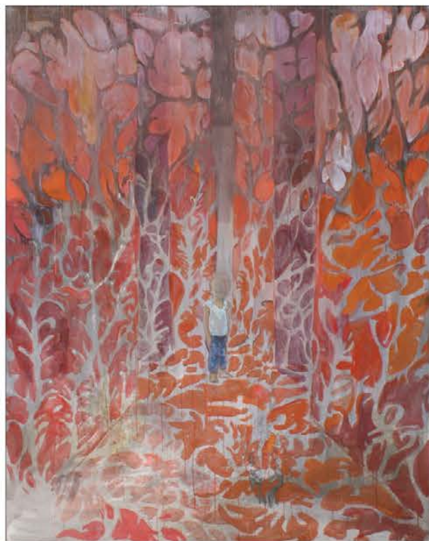
Labirint III, 2010, akrilna emulzija, olje, pigment na platno, 250x190cm

sprehaja v fiktivni in obenem realni pokrajini. Speči in meseč-