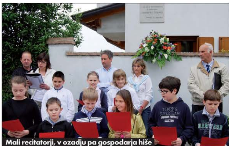
Mali recitatorji, v ozadju pa gospodarja hiše

budo društva Skultura 2001, ob sodelovanju štandreške osnovne