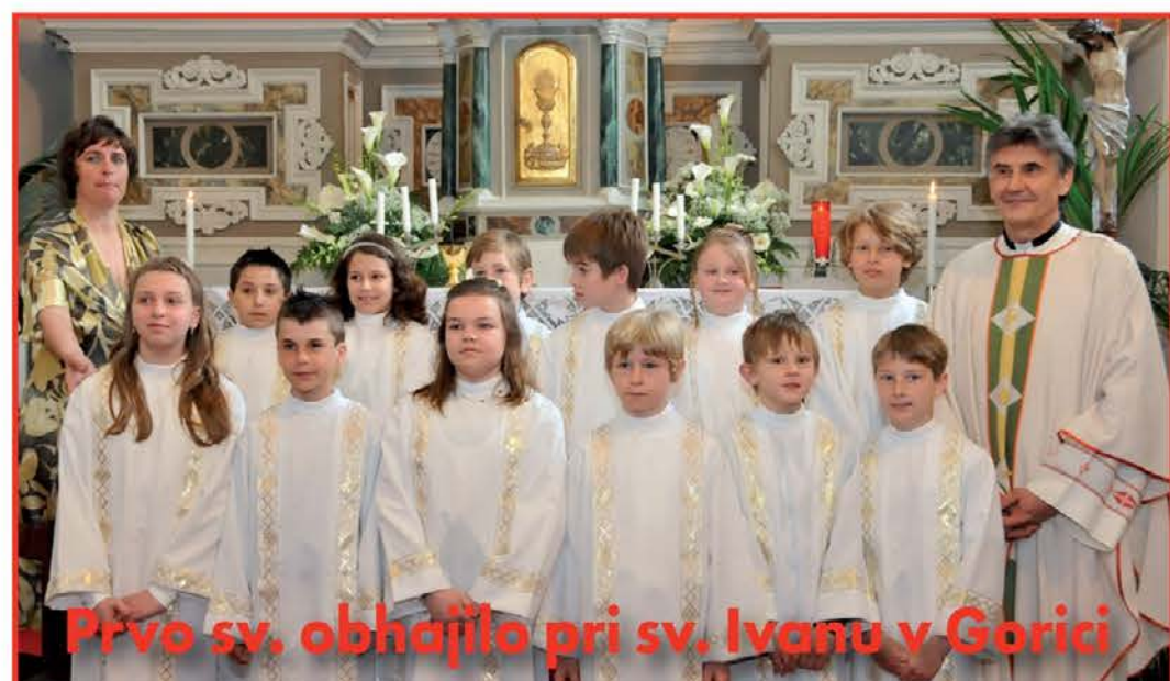
Prvo sv. obhajilo pri sv. Ivanu v Gorici

morda mu bo marsikatera med Izzivi pridobljena izkušnja pomagala pri izbiri cilja, sopotnikov ali programa. Če pa drugega ne, si upamo trditi, da bo v srcu dolgo nosil prijetne spomine na doživljanje.