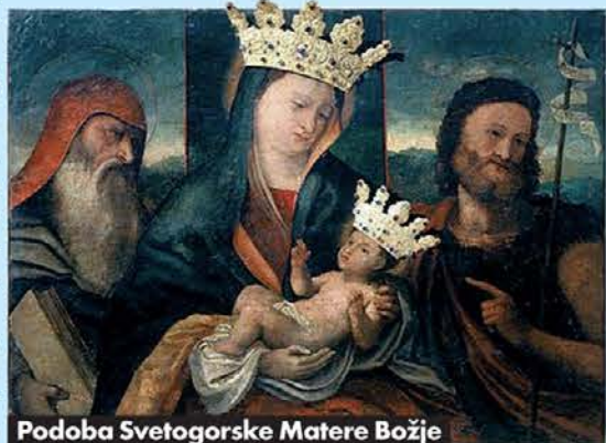
Podoba Svetogorske Matere Božje