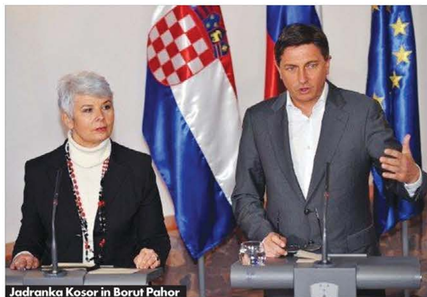
Jadranka Kosor in Borut Pahor

med sosednjima državama je s predsednico hrvaške vlade Jadranko Kosor vodil sam in dokument tudi podpisal, ne da bi se o tem posvetoval in dosegel soglasje z drugimi na slovenskem političnem prizorišču, to je s strankami, tudi opozicijskimi, in z državnim zborom. Predsednik vlade zdaj zatrjuje, da je arbitražni sporazum zgodovinskega pomena za Slovenijo, ker da bo položil temelje za nove odnose med državama v prihodnje, in zlasti, da bo arbitražno raziščeno zagotovilo stik našega morja z