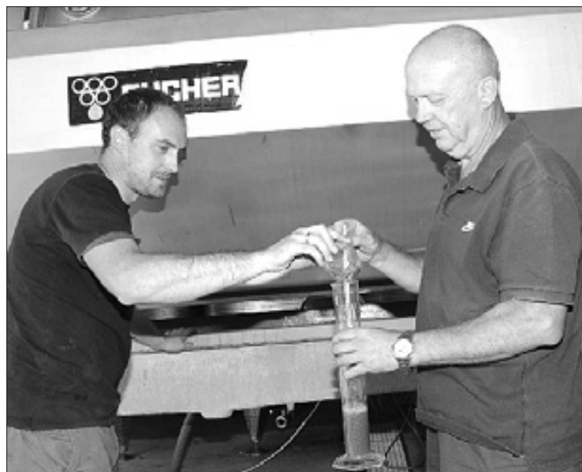
Trgategv na Jazbinah (levo); v kleti pri Figljevi na Oslavju (zgoraj)