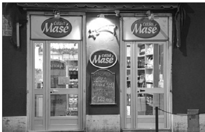
Prodajalna priljubljene znamke Masè pri Sv. Jakobu