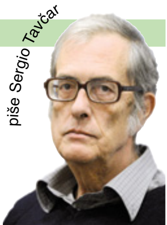
piše Sergio Tavčar

Po drugi strani pa so Francozi ostali z glavo še vedno v Tivoliju in niso se še zavedli, da je hudič odnesel šalo in da bi morali končno začeti igrati. Latvija jih je pregazila kljub temu, da so metali od zunaj tako slabo kot pred njimi še nikoli ni metala nobena baltska ekipa, kjer običajno kar mrgoli ostrostrelcev. Kako bo z drugimi pretendenti bom videl čez nekaj ur. Končam pisati in se takoj napotim v Ljubljano. Slišimo se jutri.