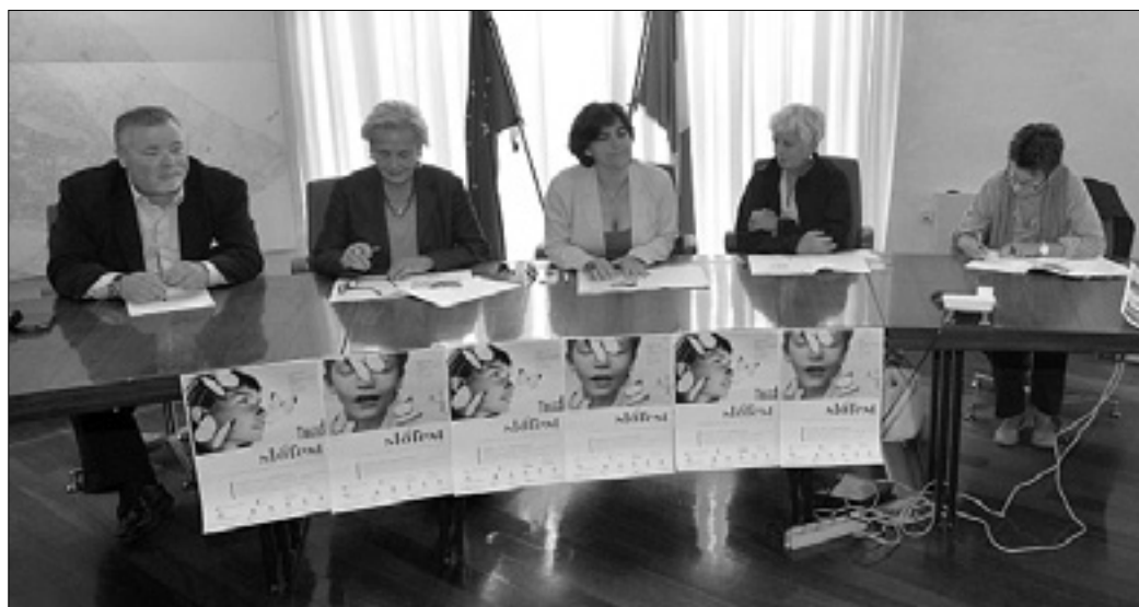
Z večerajšnje predstavitev na tržaškem županstvu