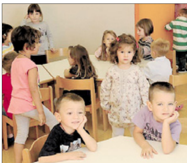
Prvi dan na osnovni šoli (levo) in v vrtcu v Bračanu (zgoraj)