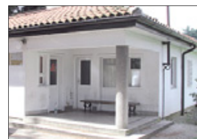
Objekt na Pristavi-Rafutu

V zvezi z nadstreškoma v Solkanu in na Erjavčevi pa na občini pojasnjujejo naslednje: ob dogovarjanju glede prenosa obmejnih objektov na občino se je ta zavezala, da bo ona poskrbela za odstranitev nadstreška v Solkanu. »To bomo storili potem, ko bomo pridobili pogodbo, s katero bo jasno, da je mejni prehod prešel v našo last,« sporočajo iz občine, kjer pa tudi razmišljajo, da bi nadstrešek na Erjavčevi iz čisto praktičnih razlogov obdržali. V primeru prireditve lahko nadstrešek obiskovalcem nudi zavetje pred padavinami ali pred soncem, zato razmišljajo o tem, kako bi ga vključili v morebitno novo ureditev.