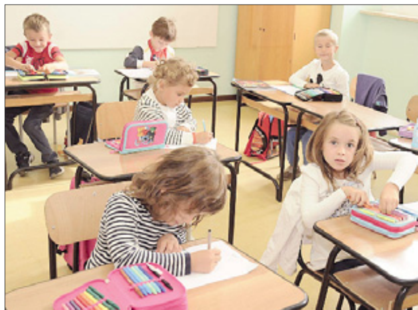
Prvošolčki v Pevmi (zgoraj) in otroci vrtca v Ulici Fabiani v Gorici (desno) BUMBACA