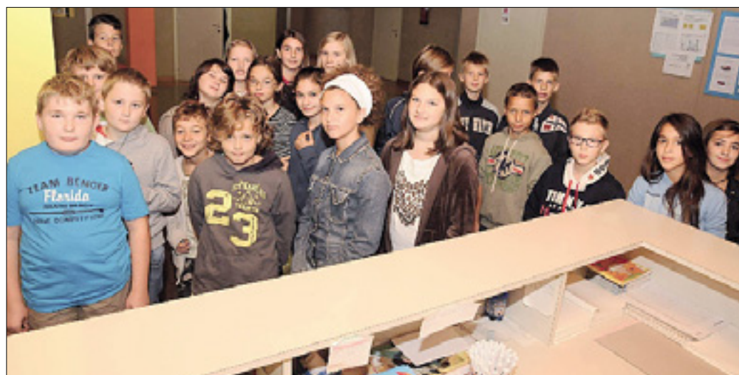
Eden izmed treh prvih razredov na nižji srednji šoli Ivan Trinko v Gorici