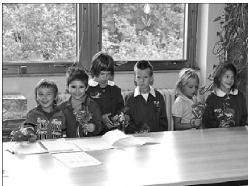
Dobrodošlica dolinskim prvošolčkom

Nekoliko neprijetno novost, predvsem za starše, predstavljajo nove tarife za šolsko menzo. Še lani so bili nekateri oproščeni plačevanja obrokov v menzi oz. je veljala za vse ena in ista tarifa. Letos pa bo slednja porazdeljena na osnovi indeksa ISEE o dohodkih. (sas)