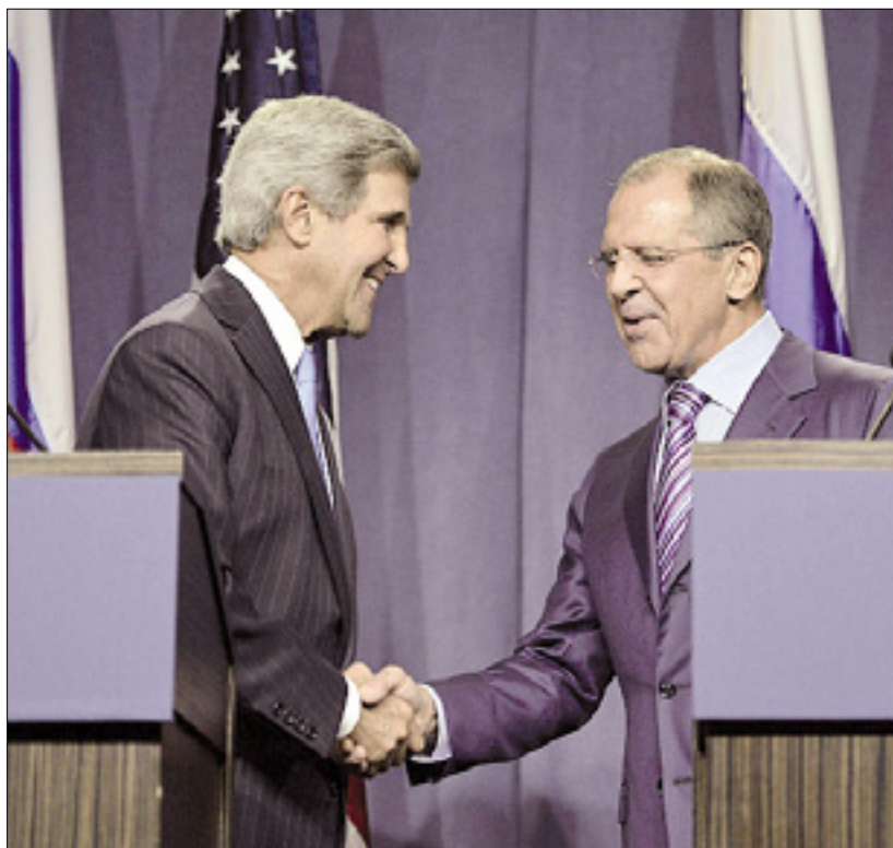
John Kerry in Sergej Lavrov ob začetku včerajšnjega srečanja v Ženevi