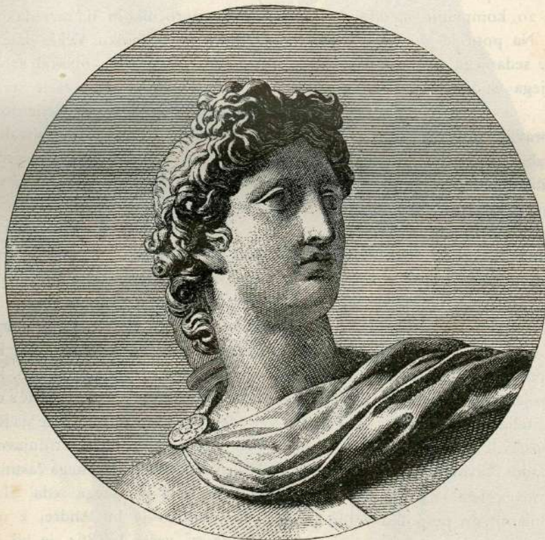
Glava „belvederskega Apolona“ v Vatikanu.