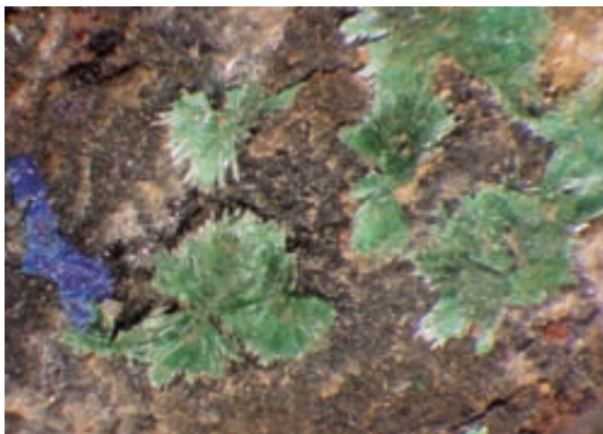
Žarkasti kristali zelenega malahita in moder azurit s Stegovnika; izrez 5 x 3 mm. Najdba in zbirka Davorina Preisingerja.

Osnovni rudni mineral je tetraedrit . Razmeroma veliko je pirita v do 4 mm velikih kristalih v obliki kock in pentagonskih dodekaedrov. Galenita in sfalerita je manj. Zelo redko najdemo izrazito rdeče prevleke cinabarita . Barit je masiven, umazano bel in razmeroma redek. Žal zaradi izrazite limonitizacije, predvsem pirita, primarni in sekundarni minerali niso tako lepo vidni.