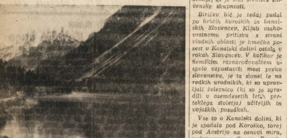
Rabelsko jezero. (Se nadaljuje) GORAZD VESEL