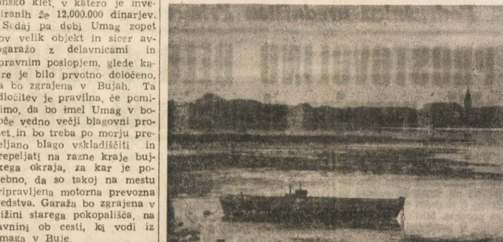
Pogled z morja na Umag