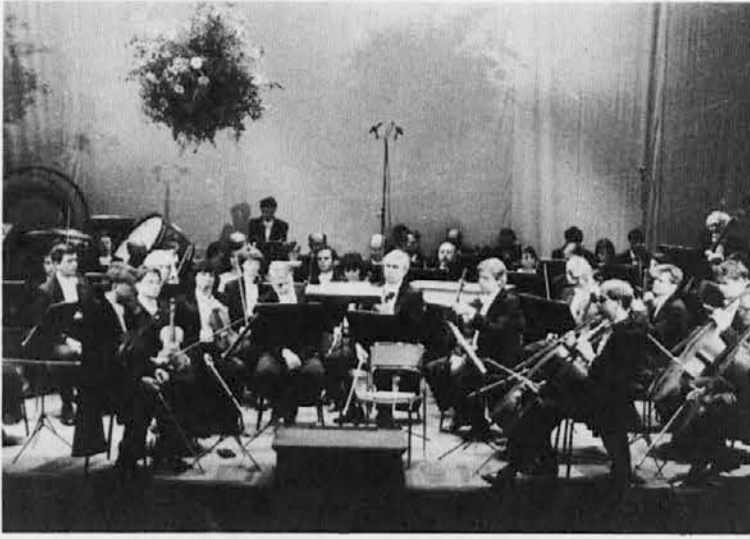
Orkester slovenske filharmonije med izvajanjem