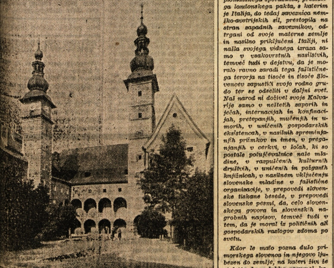
Deželni dvorec v Celovec