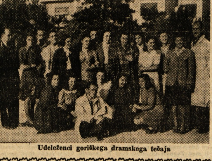
Udeleženci goriskega dramskega teaja

A. P. Čehov (1860-1904.) je bil mojster kratke povesti in drame, kateri je utrl pot za dotedanje žanrske podzvrste brezpomembnosti od oddaljenega mesta v književnosti.