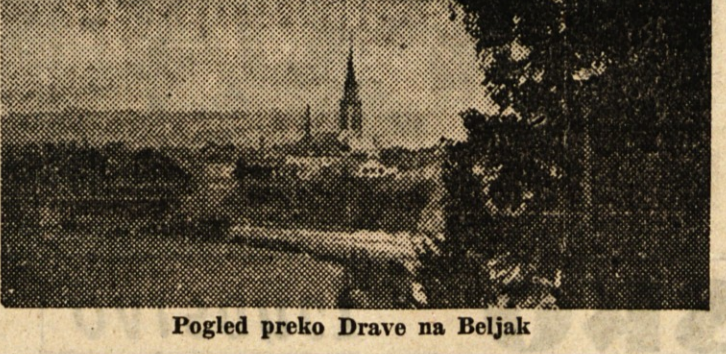
Pogled preko Drave na Beljak