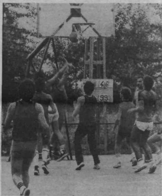
Številna športna srečanja so spremljala praznovanje na Posavju, med njimi tudi košarkarski turnir, ki ga je organizirala KS Ježica.