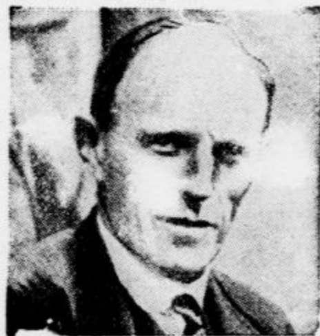
novi poslanik Vel. Britanije pri ameriški vladi, je prispel na angleški bojni ladji v Washington