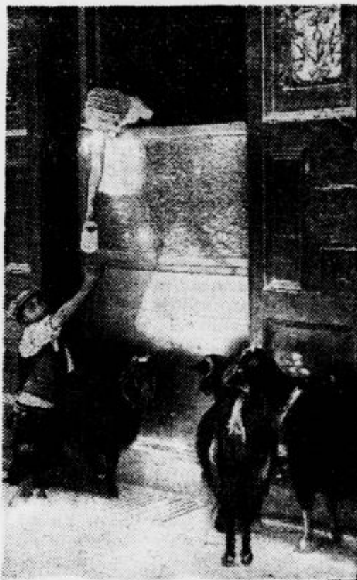
Na Malti žive prebivalci od kozjega mleka, in sicer namolže kozar naročeno količino mleka kar na ulici