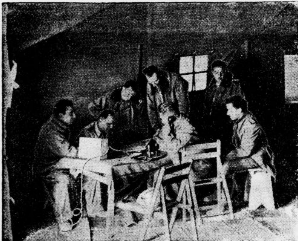
Poveljstvo nekoga italijanskega letalšča na libijskem bojišču posluje zaradi peščenih viharjev v šotoru