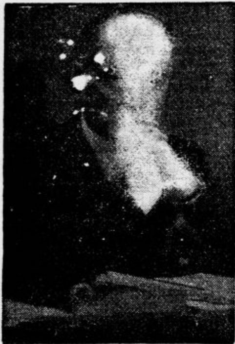
Vodja rumunske države general Antonescu je po zadnjih obžalovanjih vrednih dogodkih sestavil generalsko vlado