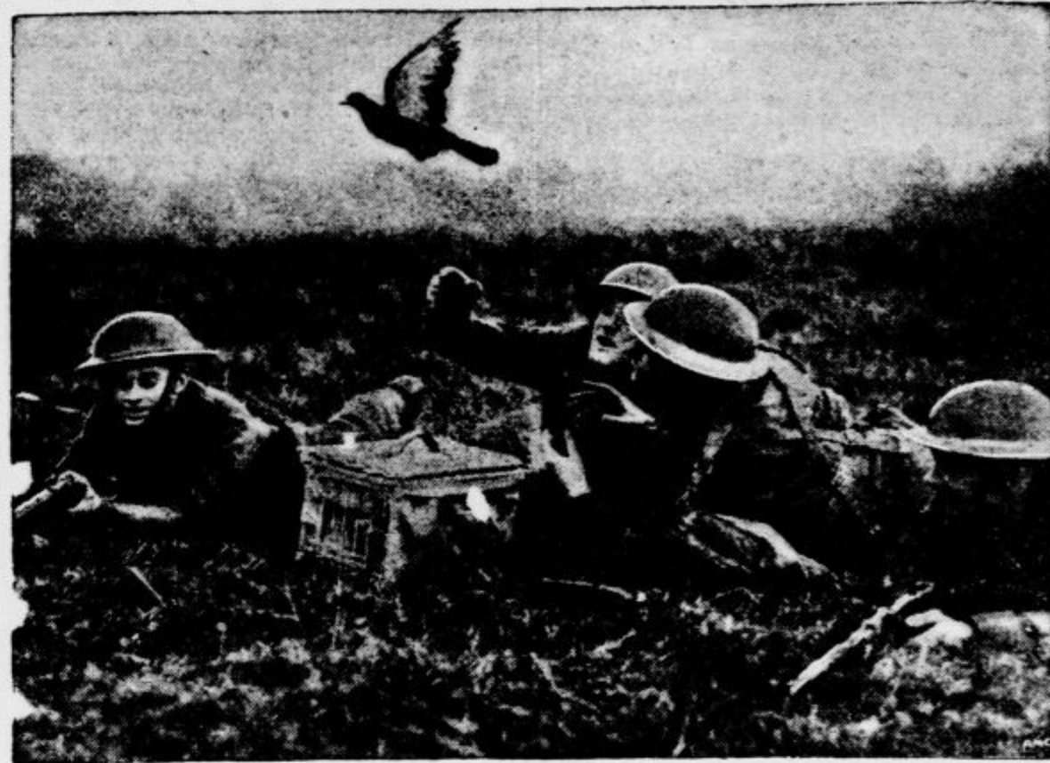
Vojaška patrolja nekje ob angleški obali se vadi v uporabijanju golobov za obveščevalno službo